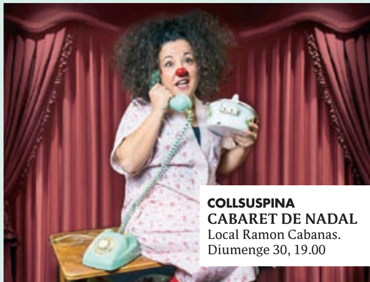
COLLSUSPINA CABARET DE NADAL Local Ramon Cabanas. Diumenge 30, 19.00

Sant Quirze Safaja. Gran bustiada reial i el tió ja caga. Durant el matí hi haurà un