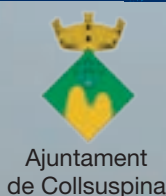
Ajuntament de Collsuspina