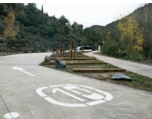
Entorn, la nova senyalització i el remodelat aparcament