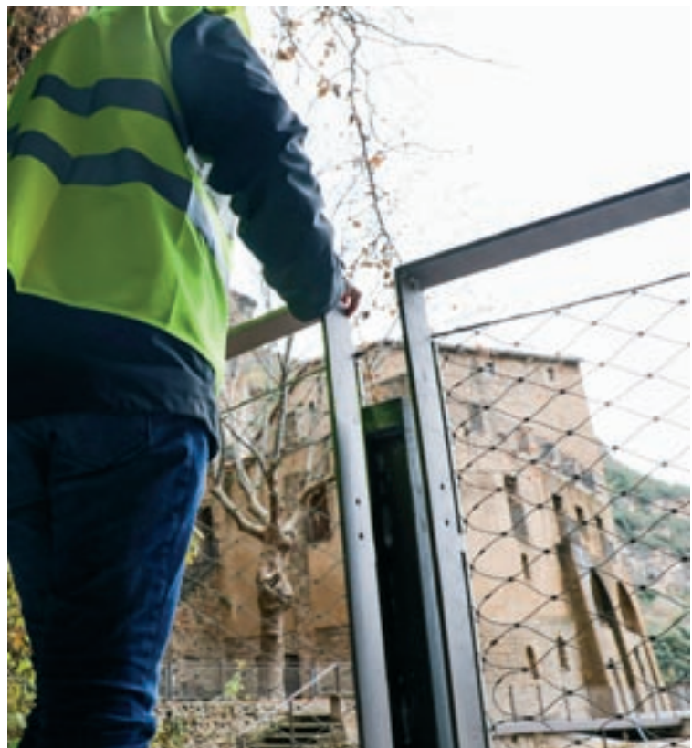
Vista general de Sant Miquel del Fai i, a sota, un detall de les noves tanques que deixen veure l'entorn natural.