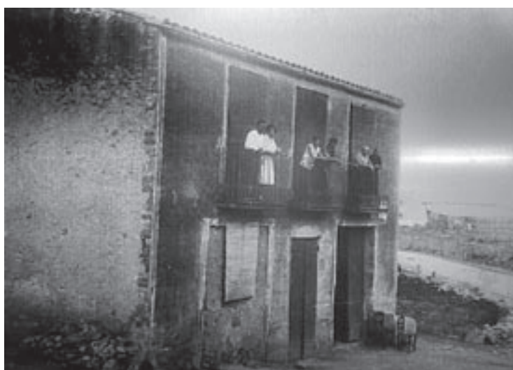
La família Soldevila, a la casa, en una imatge del 1920