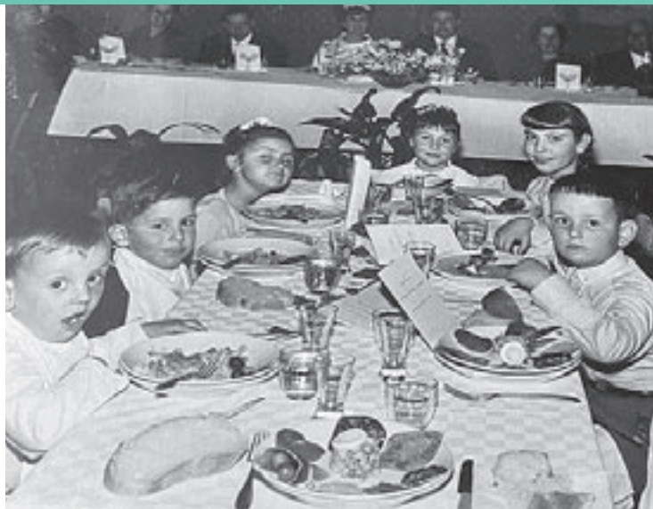
Nens assistents a un casament, l'any 1966