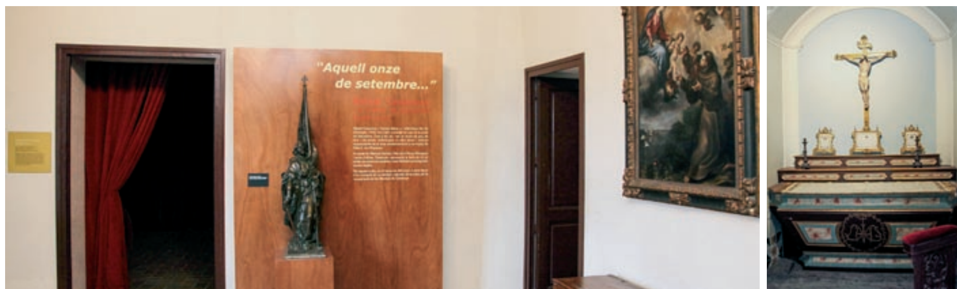
A dalt, fragments del retaule del Roser; a baix a l'esquerra, una part de l'exposició sobre la Guerra de Successió, i a la dreta, la capella