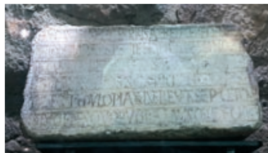
De dalt a baix i d'esquerra a dreta, estat actual de l'arc de la foradada i de l'església de Sant Miquel i l'orsa i la làpida