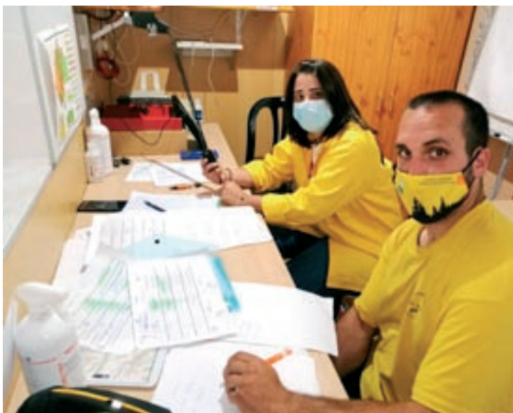
L'ADF Els Cingles té actualment una quinzena de dones voluntàries

que tenen a la societat. Per Buxó, és clau "conèixer què fa que les dones no participin en les ADF". "Hi ha moltes dones preocupades pel medi ambient i això no es tradueix en el volum de voluntàries", afegeix el president de l'ADF Els Cingles, que considera que "s'ha donat la imatge que estar en una ADF és anar a apagar foc i que, per fer-ho, és important la força.