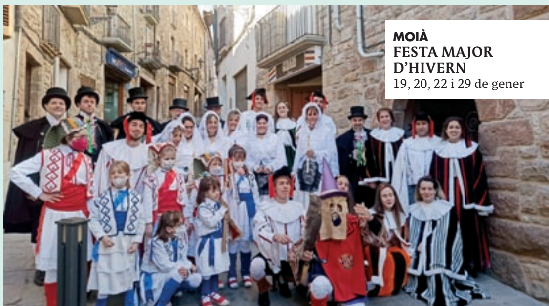
MOIÀ FESTA MAJOR D'HIVERN 19, 20, 22 i 29 de gener