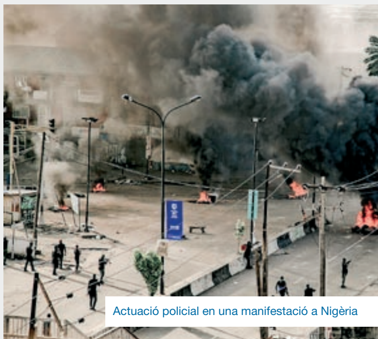
Actuació policial en una manifestació a Nigèria