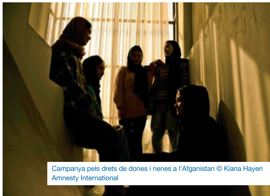
Campanya pels drets de dones i nenes a l'Afganistan

En els últims mesos l'organització ha estat treballant en diferents campanyes a Catalunya. Una és fer incidència perquè el pressupost que el govern de la Generalitat dedica a Salut un 25% es destini a l'atenció primària (actualment és un 17%): "Ens preocupa l'elevat temps d'espera que hi ha perquè una persona sigui atesa pel seu metge de capçalera". Aquest increment de pressupost permetria destinar-hi més recursos de personal, de material i d'espais.