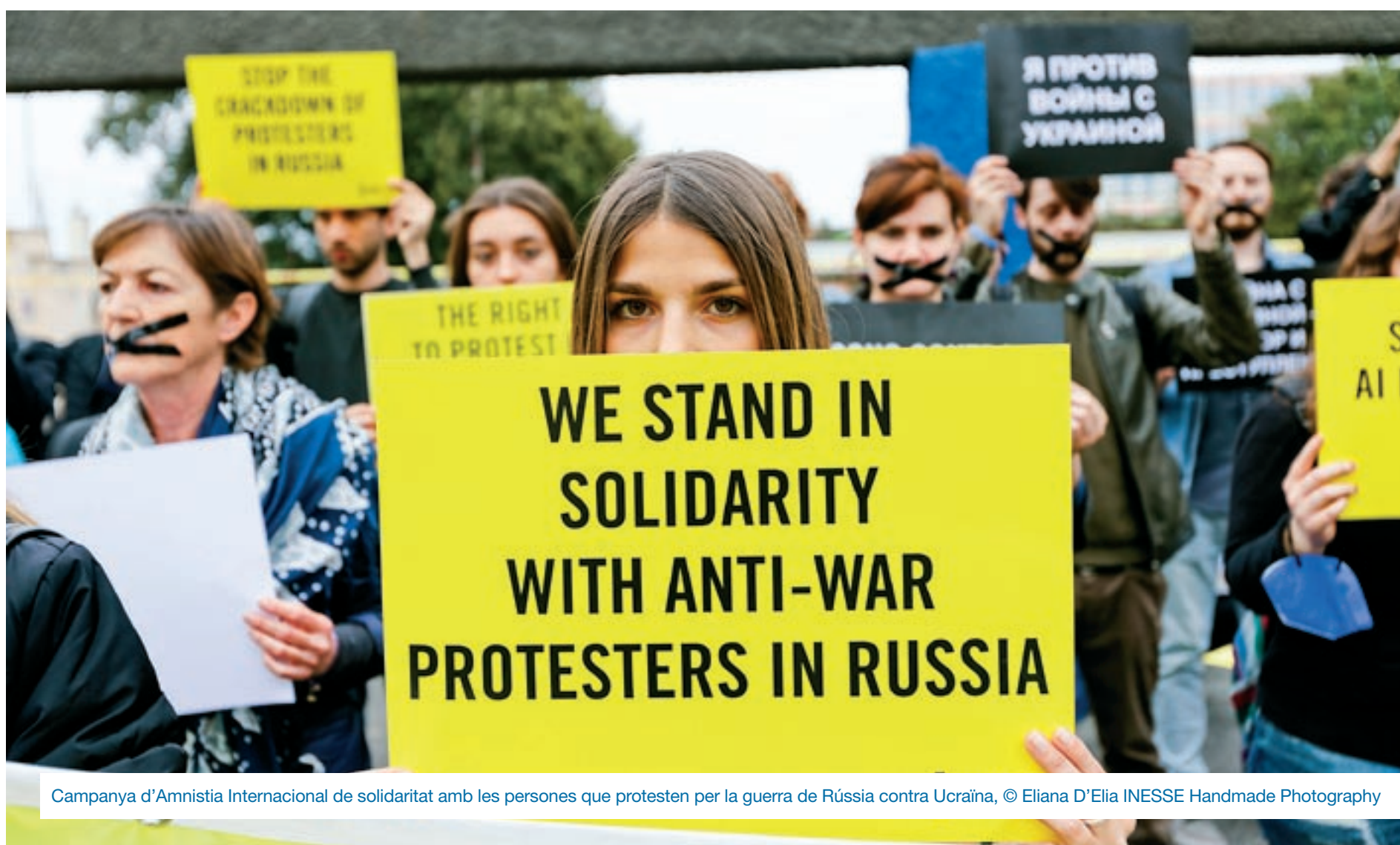
Campanya d'Amnistia Internacional de solidaritat amb les persones que protesten per la guerra de Rússia contra Ucraïna

Promoure societats pacífiques i inclusives per al desenvolupament sostenible, proporcionar accés a la justícia per a tothom i crear institucions eficaçes, responsables i inclusives a tots els nivells és el que es proposa l'ODS 16. En síntesi: pau, justícia i institucions sòlides.