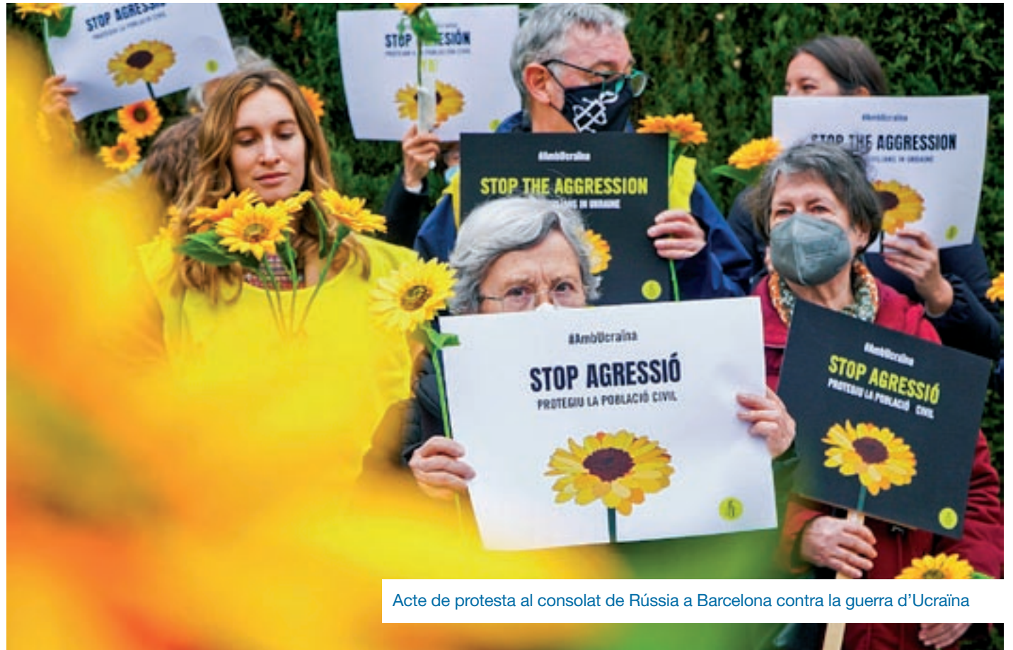
Acte de protesta al consolat de Rússia a Barcelona contra la guerra d'Ucraïna

AI va néixer l'any 1961. Eren anys en què les reivindicacions es feien signant cartes a mà. L'any 2001 es va fer la primera ciberacció, una recollida de signatures per internet. Ara a través de les xarxes socials també fan molta feina. Sobre els activistes, Ribas explica que ara la gent s'uneix més a una causa concreta que a una organització.