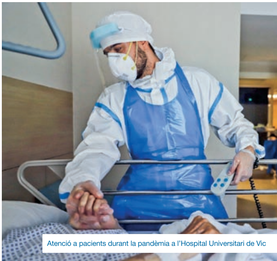
Atenció a pacients durant la pandèmia a l'Hospital Universitari de Vic

Al analitza i documenta: morts en residències, dèficits en l'atenció primària, el tracte als migrants i la llibertat d'expressió