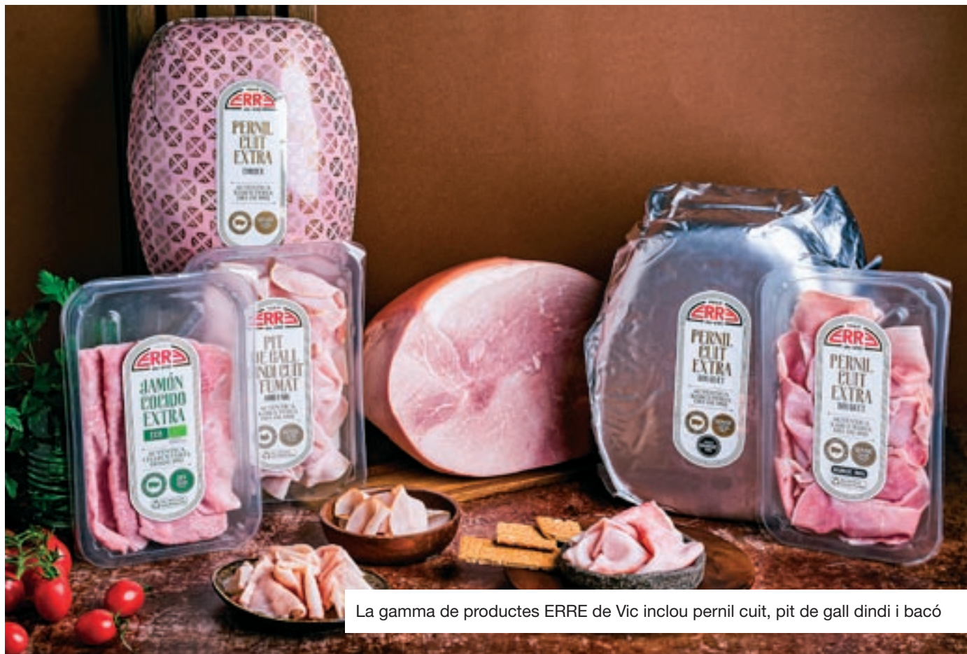
La gamma de productes ERRE de Vic inclou pernil cuit, pit de gall dindi i bacó