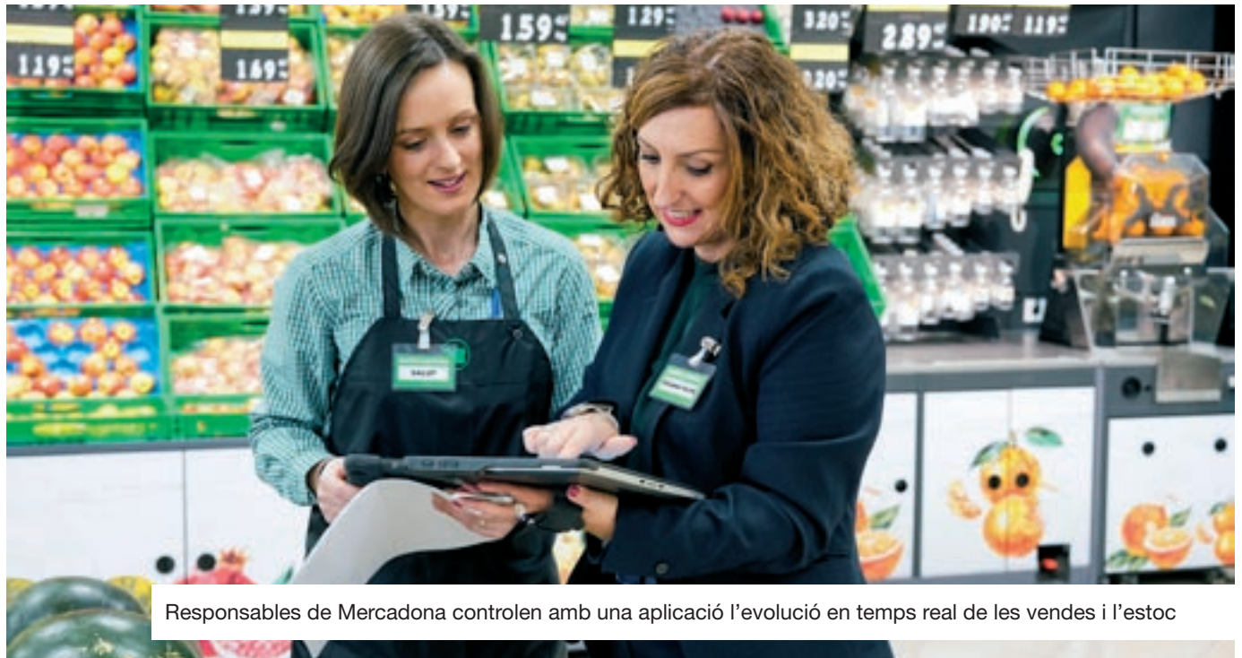
Responsables de Mercadona controlen amb una aplicació l'evolució en temps real de les vendes i l'estoc

Evitar ruptures. Per exemple, sempre que és possible s'utilitzen les darreres innovacions en envasa-