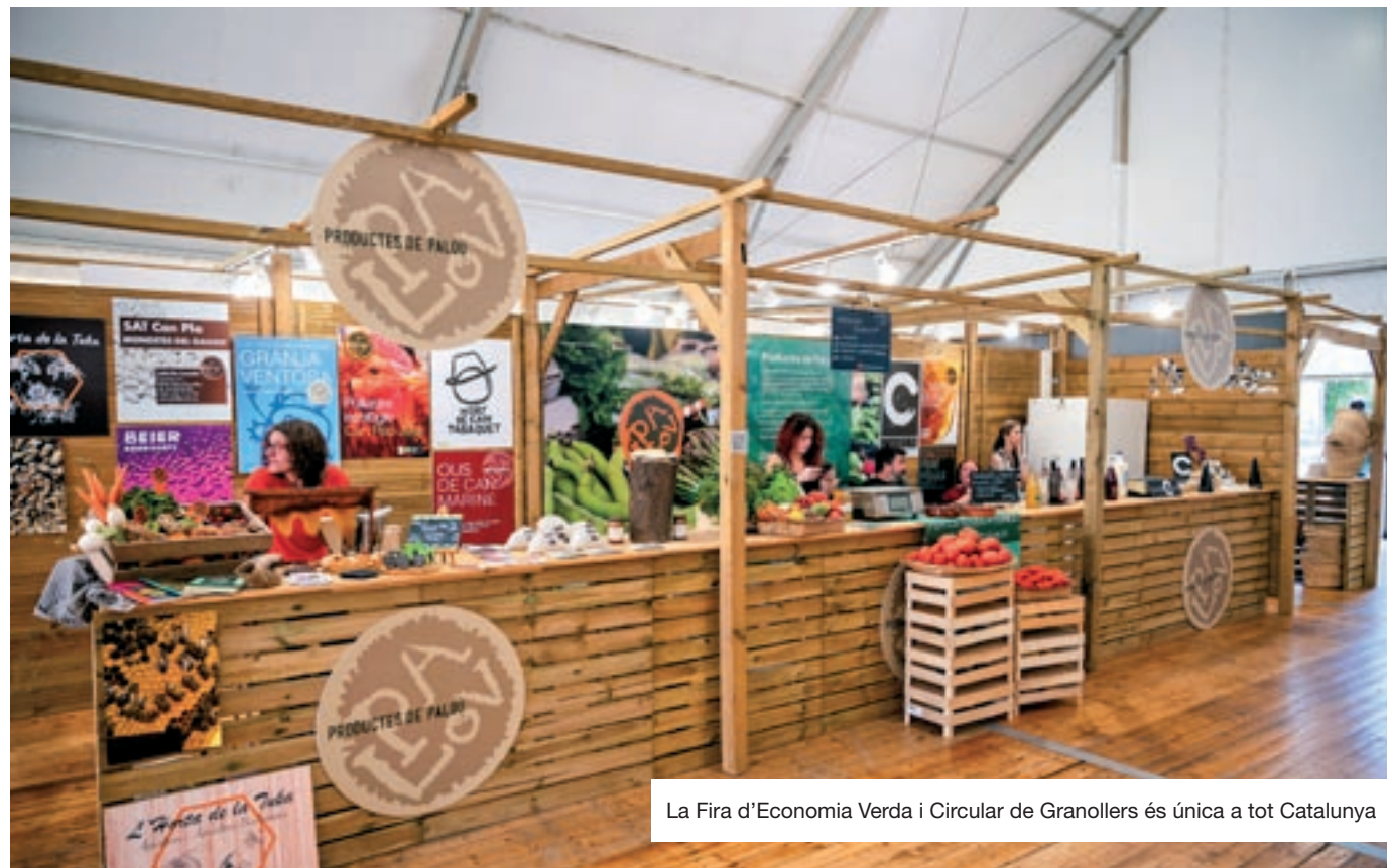
La Fira d'Economia Verda i Circular de Granollers és única a tot Catalunya

tat de Granollers està liderant el repte cap a la transició verda, en sintonia amb els objectius de desenvolupament sostenible marcats per l'Agenda 2030. La consolidació d'un model firal orientat cap als valors d'economia verda fan que el compromís de la ciutat amb el planeta es reafirmi i serveixi com a palanca per assolir-ne els objectius.