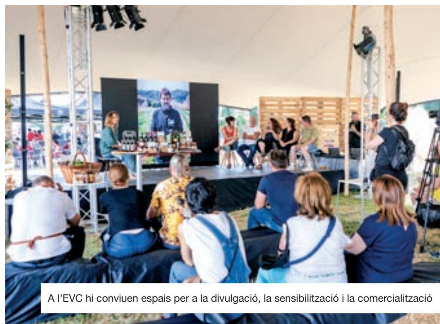
A l'EVC hi conviuen espais per a la divulgació, la sensibilització i la comercialització

El gir de model de Fires i Festes de l'Ascensió, posant el focus sobre la Fira d'Economia Verda i Circular, no fa renunciar als orígens ni a la tradició d'aquesta festivitat. L'agenda de fires es complementarà amb una àmplia i diversa proposta d'activitats festives i culturals, convertint aquest en un projecte transversal que implica tota la ciutat i el teixit econòmic, social i cultural cap a un model de vida més just, equitatiu, saludable i sostenible.