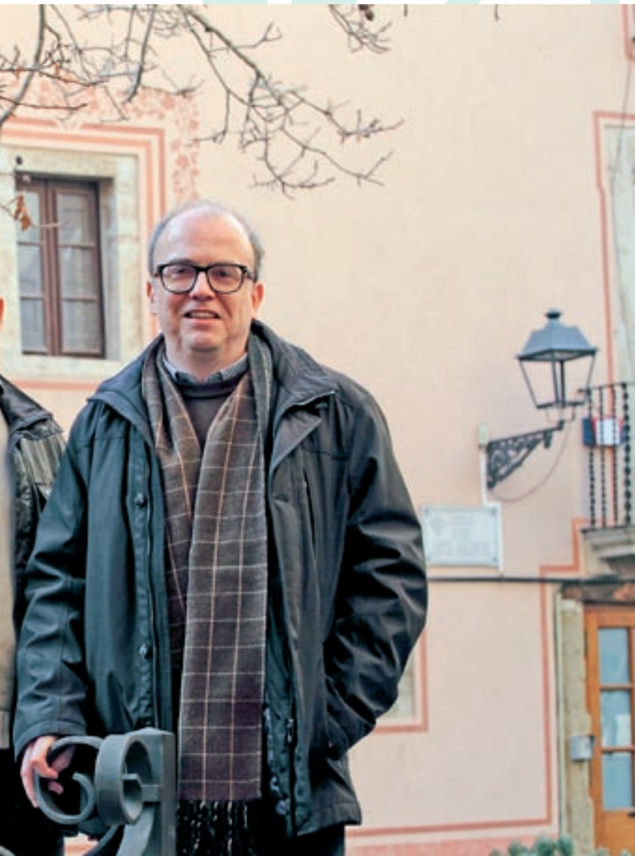
Tosca' és a Can Carner, l'edifici del Consell Comarcal del Moianès

revista Modilianum sorgeixen de les jornades de patrimoni organitzades periòdicament. En el cas de La Tosca es reuneixen periòdicament per decidir temàtiques?