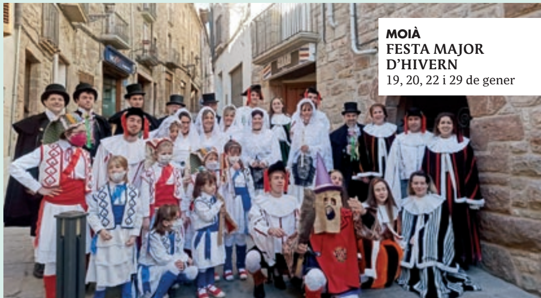
MOIÀ FESTA MAJOR D'HIVERN 19, 20, 22 i 29 de gener