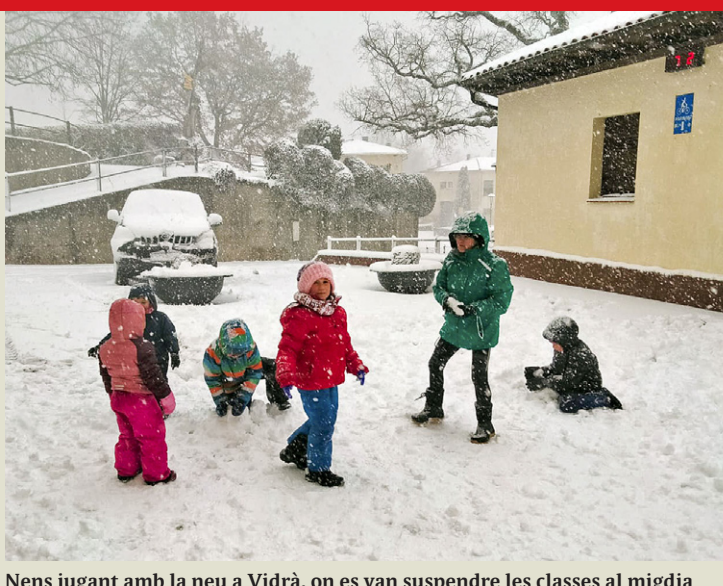
Nens jugant amb la neu a Vidrà, on es van suspendre les classes al migdia

La nevada de dimarts –que va deixar gruixos de neu de fins a 30 centímetres a les cotes més altes– va provocar problemes a les carreteres d'Osona i el Ripollès. L'eix Vic-Olot va estar tallat durant dues hores i va ser obligatori l'ús de cadenes a l'Eix Transversal. Un accident a Tona també va generar cues a la C-17. A alguns nuclis de Molló van estar 19 hores sense electricitat com a conseqüència del temporal.