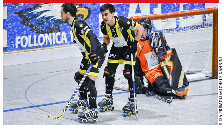
ELISA PREMOLI/MICHELE NANNINI