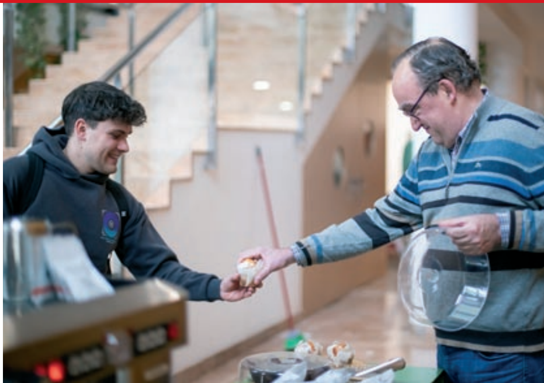
Un alumne de la Universitat de Vic adquirint una de les magdale

El projecte ha tingut un gran impacte en la comunitat universitària i en general, ja que ha facilitat la interacció entre persones amb discapacitat intel·lectual i els professors, estudiants i altres professionals de la universitat. A més, ha creat nous vincles i ha permès la visibilització