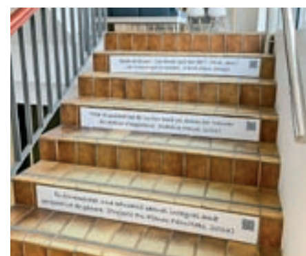
UVIC / ALBERT LLIMOS