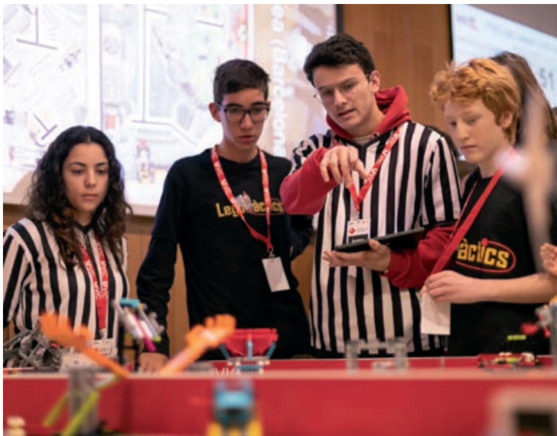
Dues imatges de la competició, que es va fer el 25 de febrer a la Universitat de Vic

estrès, nervis d'última hora per tenir-ho tot controlat, però normalment surt sempre tot bé”.