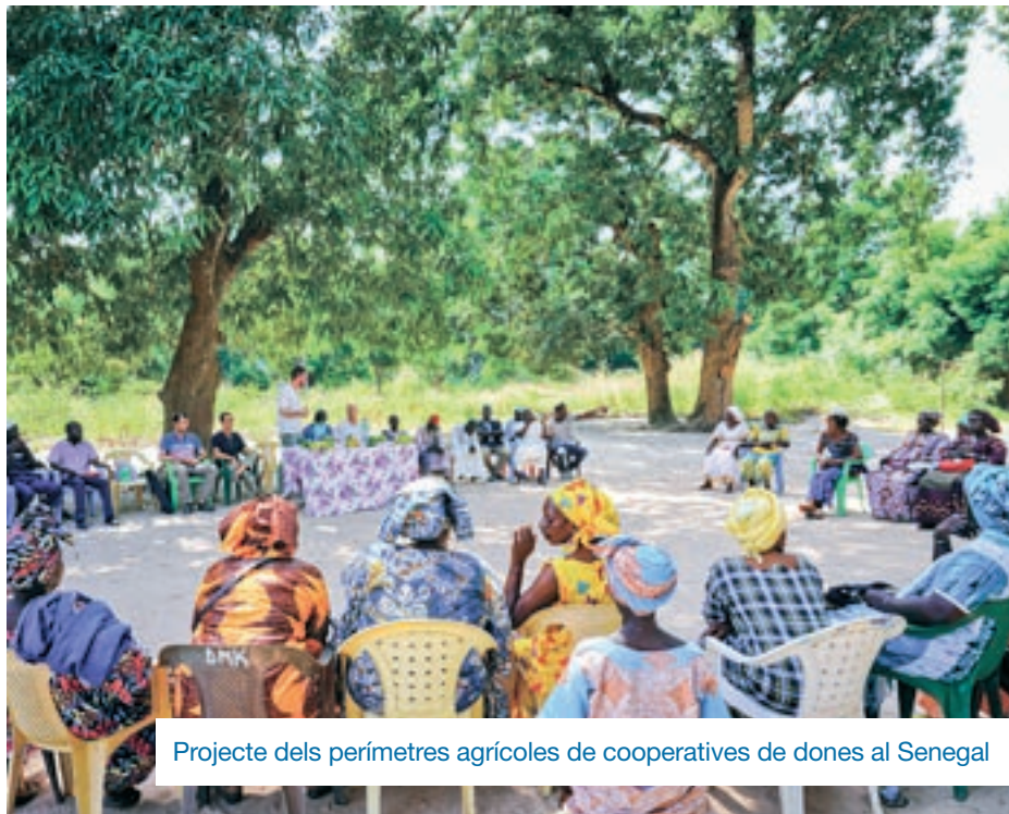
Projecte dels perímetres agrícoles de cooperatives de dones al Senegal