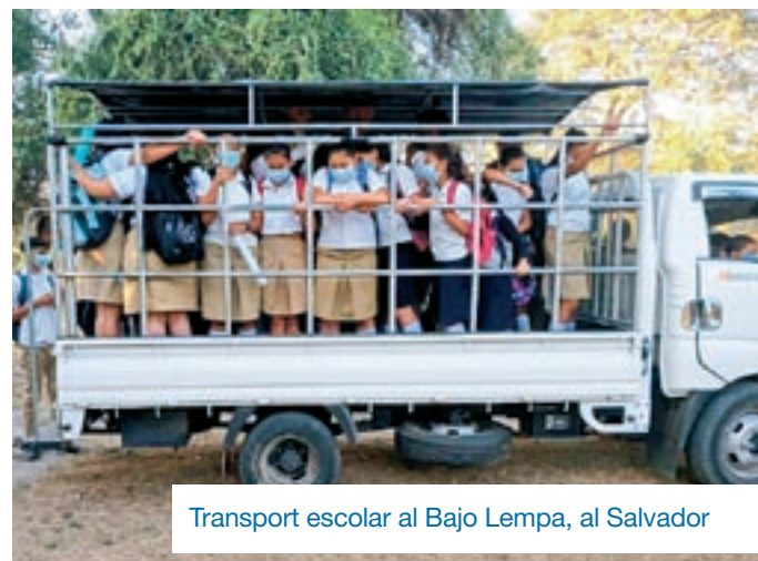
Transport escolar al Bajo Lempa, al Salvador

jectes solen crear un vincle entre les comunitats perquè, en ocasions, hi ha tècnics o regidors que hi viatgen, viuen de prop com s'estan executant i poden avaluar-ne l'impacte sobre les persones beneficiàries.