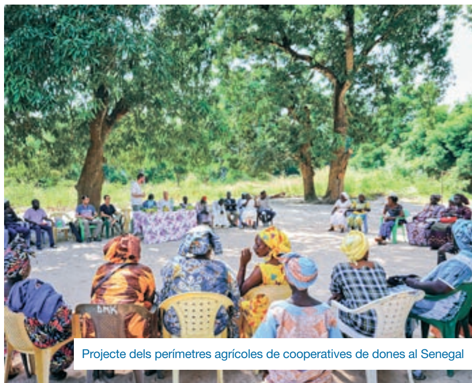
Projecte dels perímetres agrícoles de cooperatives de dones al Senegal

jectes del fons, com també ho ha fet en els últims mesos la guerra d'Ucraïna. Això, però, no els ha fet abandonar projectes que es porten a terme des de fa molts anys amb comunitats locals de països del Sud. Aquests pro-