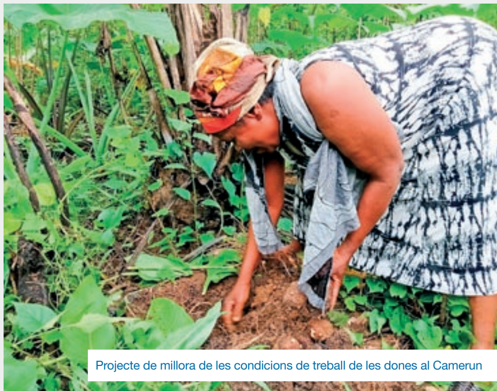
Projecte de millora de les condicions de treball de les dones al Camerun

En la seva opinió, caldria treballar per intentar buscar un mecanisme de sobirania en àmbits com l'alimentari o de tots els processos productius per garantir que totes les regions i països "tinguem capacitat d'emancipar-nos econòmicament i social". I apunta que si no hi ha aquesta capacitat de garantir l'emancipació i anem només amb una lògica de benefici màxim per a les empreses que estan segmentant i deslocalitzant els drets, "no ens estranyi després que trobem que es comencin també a segmentar els drets a casa nostra". Si ha passat als països del Sud, "per què no ens ha passar també a nosaltres?", conclou.