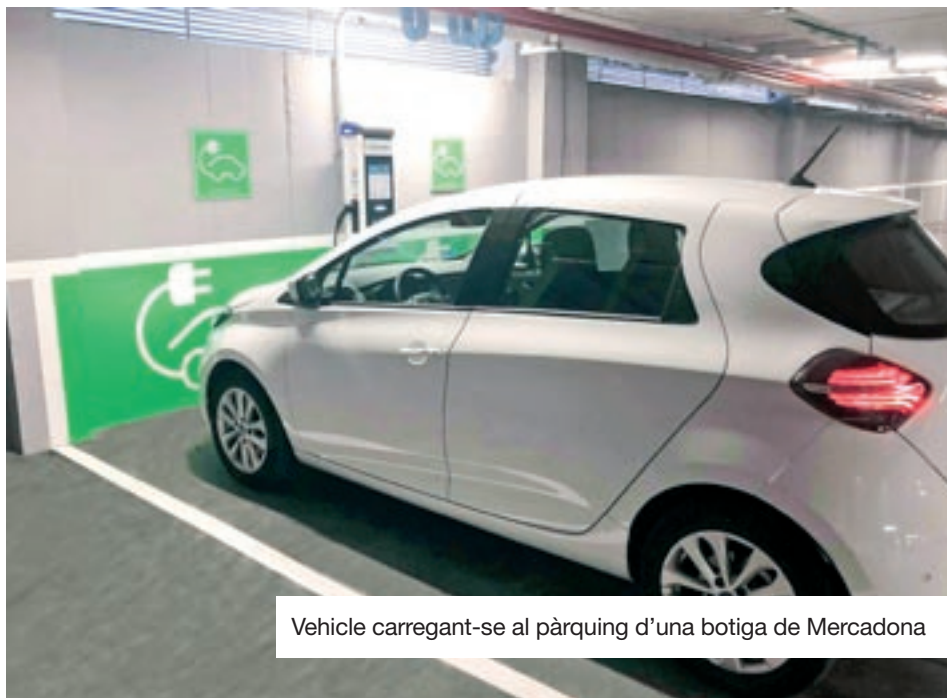
Vehicle carregant-se al pàrquing d'una botiga de Mercadona

Clemente subratlla que les persones usuàries de vehicle elèctric que utilitzin aquests carregadors "podran reduir aproximadament fins a la meitat el cost d'un trajecte respecte del seu equivalent tradicional".