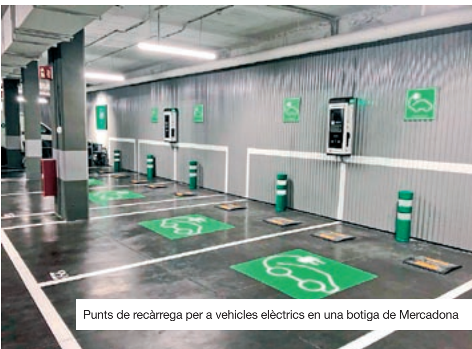
Punts de recàrrega per a vehicles elèctrics en una botiga de Mercadona

La recàrrega serà fins a sis vegades més ràpida i passarà d'oferir 3,7 a 22 kW. Dels 2.000 punts actuals, 100 ja tenen el servei