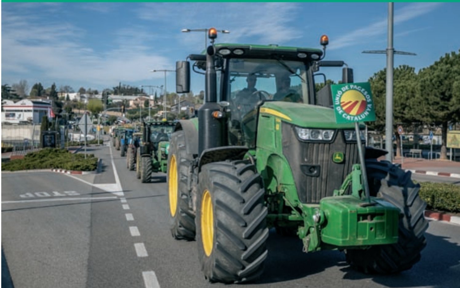
Tractors aquest diumenge al matí a la C-155, poc després d'emprendre la marxa des de l'aparcament d'Els Àngels

Alerten que els danys provocats per la fauna salvatge posen el sector al límit (Pàgina 5)