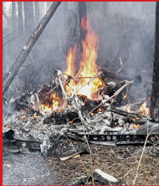
Restes d'un dels aparells