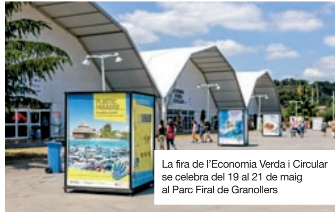
La fira de l'Economia Verda i Circular se celebra del 19 al 21 de maig al Parc Firal de Granollers

A Catalunya, en un moment en què s'estan definint mesures decisives per frenar l'impacte de la crisi climàtica i avançar en l'economia circular, neix el Pacte per a la Moda Circular, entre institucions i empreses del sector tèxtil, amb la voluntat de facilitar la incorporació de mesures de circularitat, l'impuls de projectes col·laboratius i la millora de la competitivitat en la indústria tèxtil. Aquesta iniciativa sectorial és una de les accions pilot d'economia circular triades per la Unió Europea, dins del projecte Interreg Europe CircE, pel seu caire innovador i el seu potencial de replicabilitat en altres territoris.