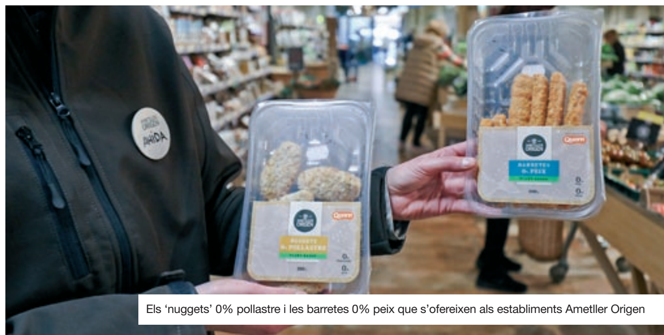
Els 'nuggets' 0% pollastre i les barretes 0% peix que s'ofereixen als establiments Ametller Origen

Al llarg dels últims segles, la carn ha estat àmpliament consumida pels humans a causa, principalment, de la seva aportació energètica i de proteïnes d'alta qualitat beneficioses per al múscul, entre altres propietats. Les proteïnes són el component principal de les nostres cèl·lules i, sens dubte, són necessàries per al creixement, la reparació i la contínua renovació dels teixits, motius pels quals és fonamental incorporar-les al llarg de la nostra alimentació. Així, les principals fonts proteiques consumides són les carns, els làctics, el peix, els ous,