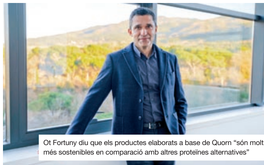
Ot Fortuny diu que els productes elaborats a base de Quorn "són molt més sostenibles en comparació amb altres proteïnes alternatives"

Aquest, precisament, és un dels principals reptes als quals ha de fer front la indústria alimentària: aconseguir aliments amb l'ús d'ingredients vegetals que permetin assolir