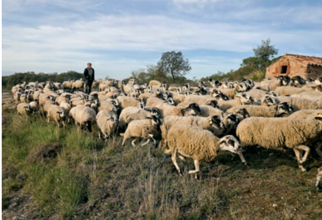
Un ramat d'ovelles, sobre una zona de pastura totalment seca, el passat dimecres a Seva

Els diferents ajuntaments implicats posen com a exemple d'èxit, i model a seguir, el de l'associació agroforestal Estella del Montseny, que ja compta amb una planta de pèl·let, a partir de la gestió dels boscos de l'entorn i