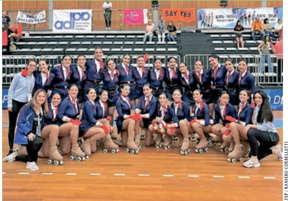
A l'esquerra, el grup de xou petit tonenc i a la dreta, el grup de xou gran