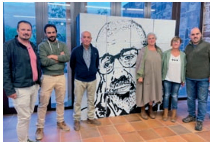
Ramaders i alcaldes dels municipis fundadors, dimecres al Brull

Una altra de les tasques que volen promoure és la divulgació de la seva activitat o crear consciència, per exemple, de portar els gossos lligats quan se circula per zones de pastura. "Hi ha dificultats i alhora ens hem d'adonar que la ramaderia extensiva és un benefici per a la biodiversitat i una riquesa a l'hora d'evitar incendis. És imprescindible que cuidem el sec-