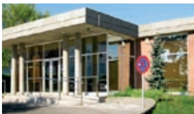
C/ Castellot, 15 - Manlleu

Tanatori 3 sales de vetlla Servei de cremació Aparcament propi Zona de descans