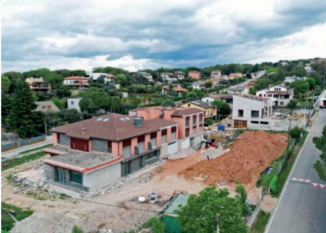
Estat actual de l'edifici, que es va començar a construir l'any 2007 i que havia de ser un hotel de tres estrelles

La compra de l'hotel de la Roca per part de l'empresa osonenca va ser un dels punts que es va posar sobre la taula a l'assemblea de veïns de la Roca, el passat dijous. Els veïns van veure amb bons ulls que es desencallés, d'una vegada per totes, el futur d'aquest espai en desús durant més de quinze anys. La mateixa empresa que ha adquirit el terreny i