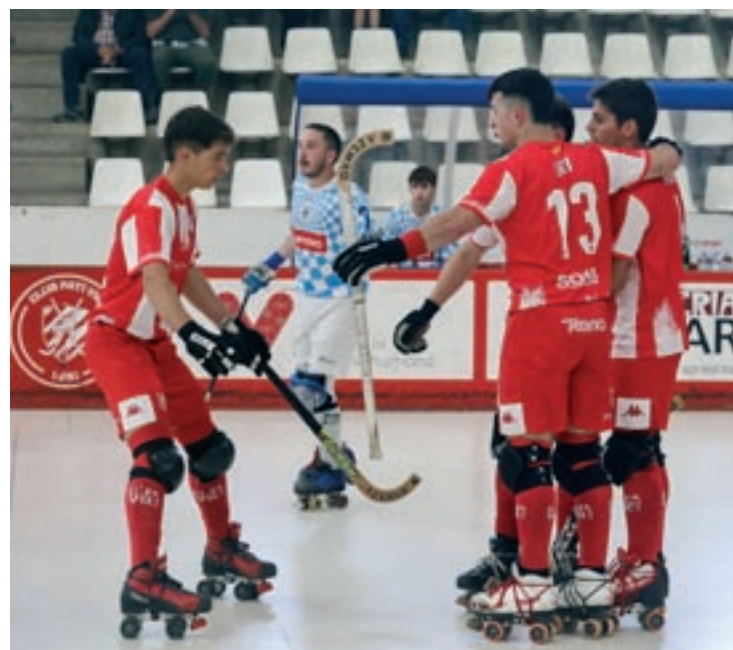
Els vigatans, celebrant un dels gols de dissabte a la tarda

El conjunt vigatà va mostrar la seva superioritat ja en el primer minut. El gol va arribar ben d'hora amb un xut des de mitja pista de Soler que es va colar per l'escaire de la porteria de Meri-