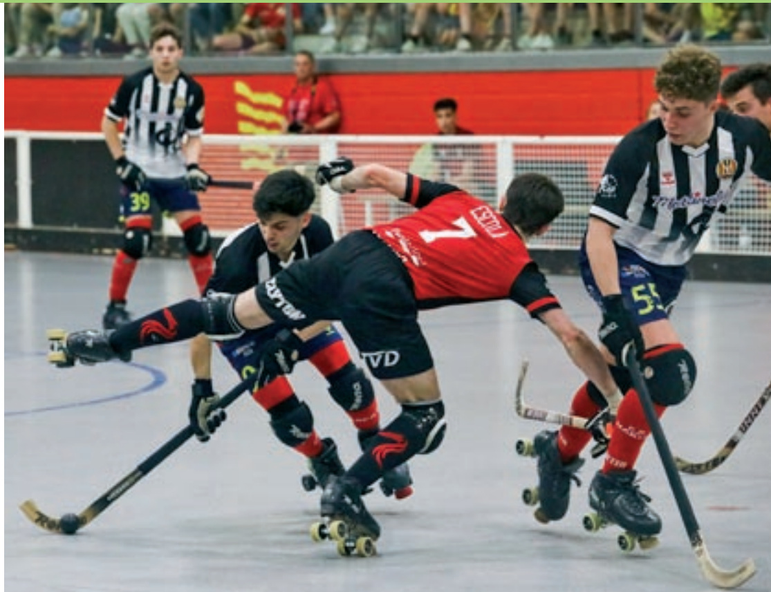
Els manlleuencs van topar contra un bon Rivas Las Lagunas en l'últim partit de la temporada

A la primera part, els osonencs van ser superiors al seu rival i van sortir molt més endollats a la pista. Una de les primeres grans oportunitats va ser per al conjunt local. Una targeta blava assenyalada a Monserrat va permetre a Moncusí executar el llançament de falta directa. El manlleuenc tirava fort pel centre i superava el porter per fer pujar el primer a l'electrònic i fer explotar d'alegria una afició cada vegada més entregada amb el pas dels minuts. El Rivas, desaparegut en els primers 25 minuts, van disposar d'un tir aïllat de Pos, que Panella aturava amb el casc. De nou, els visitants van tenir una