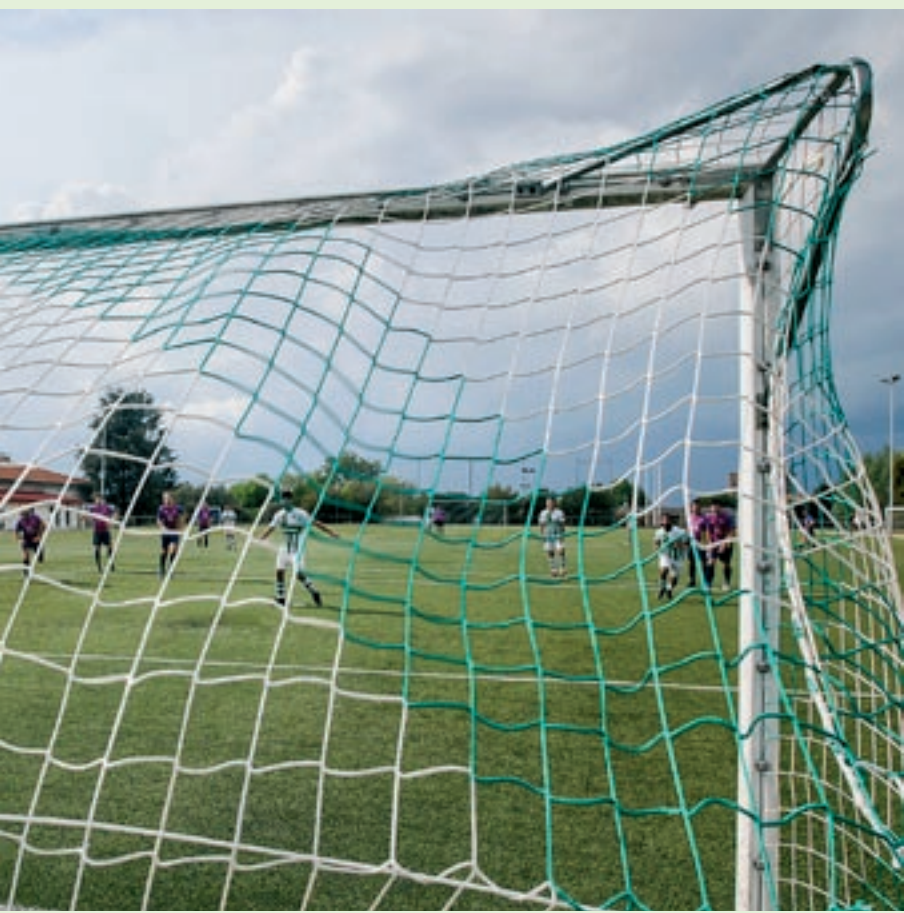
on va superar Fernández en el llançament de penal que va significar el 2 a 1