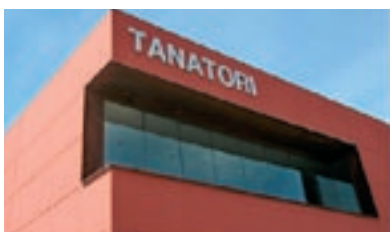
C/ Sot dels Pradals, 2 - Vic