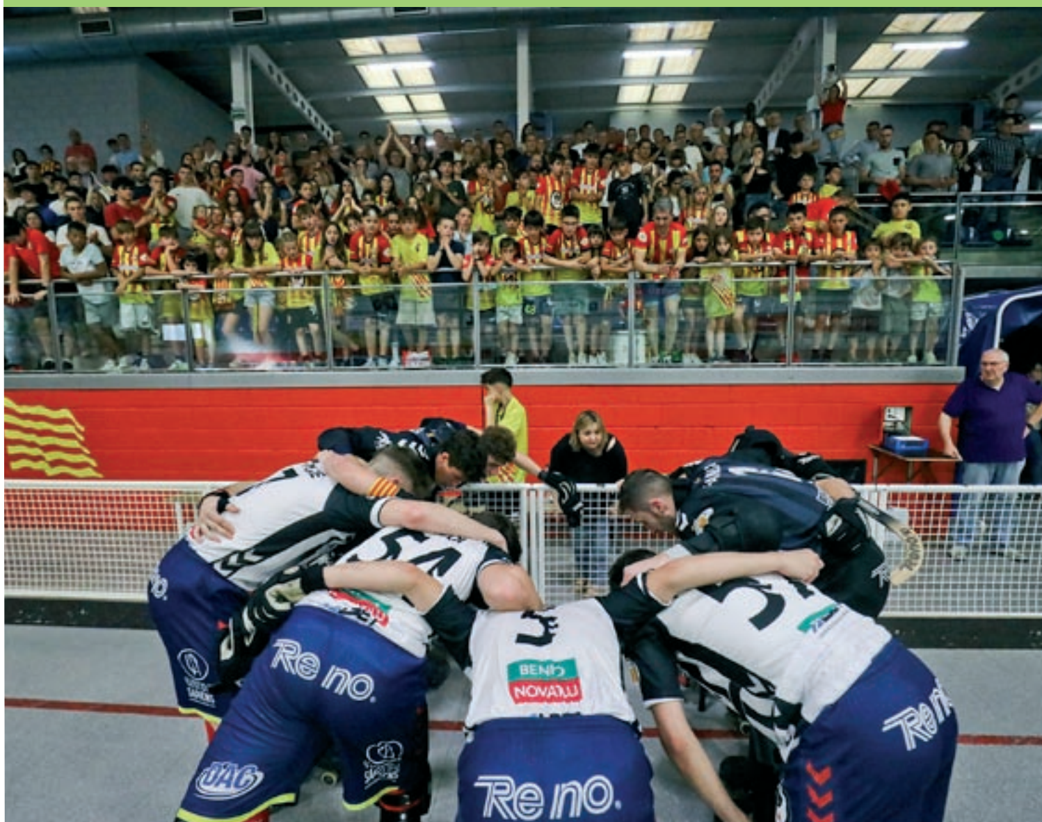
El jove conjunt manlleuenc va tancar una temporada per emmarcar amb el suport de la seva afició

El Martinelia Manlleu cau a casa contra el Rivas i es queda sense ascens directe, de manera que es jugarà tornar a l'OK Lliga contra el Sant Just