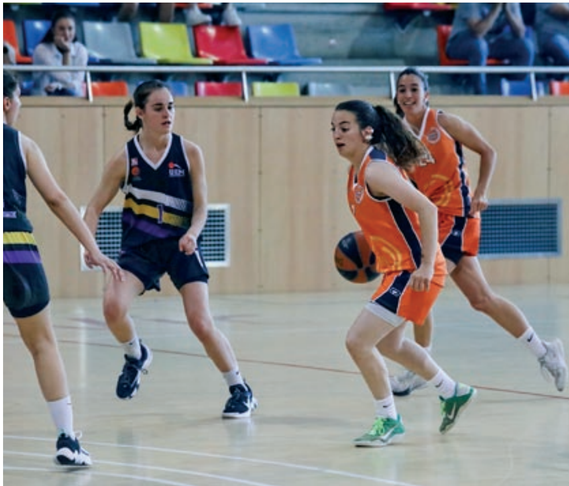
El Femení Osona es va imposar amb claredat al Femení Maresme dissabte a casa

Tordera El Vic no aconseguí la victòria que l'acostava a l'ascens i haurà de guanyar un dels dos partits que queden per pujar a primera catalana. Els vigatans van començar molt bé el partit,