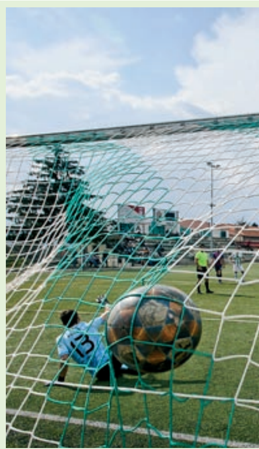
La pilota impacta a la xarxa en el moment que Pol Reinó