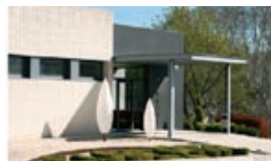
C/ dels Casals, 5 - Centelles

Tanatori, crematori i oficines 8 sales de vetlla Sala Multiconfessional Jardí del Repòs amb columbaris Zona vending