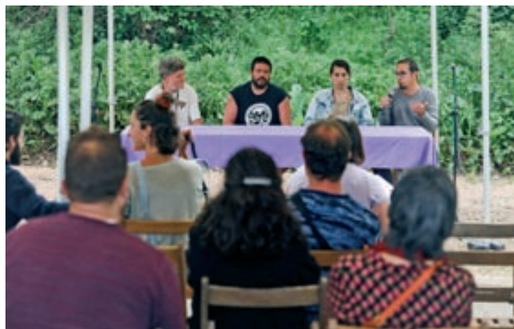
A dalt, el moment de màxima afluència diumenge al matí. A baix, públic escoltant consells i la taula rodona sobre sobirania alimentària

capves vegetals en cultius com el de la vinya, evitant el procés de llaurat.