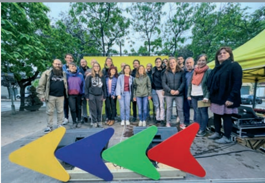
Foto de família de la CUP Manlleu, divendres a la plaça de Gràcia

Aquest teló de fons, i la música de Sixtus en format