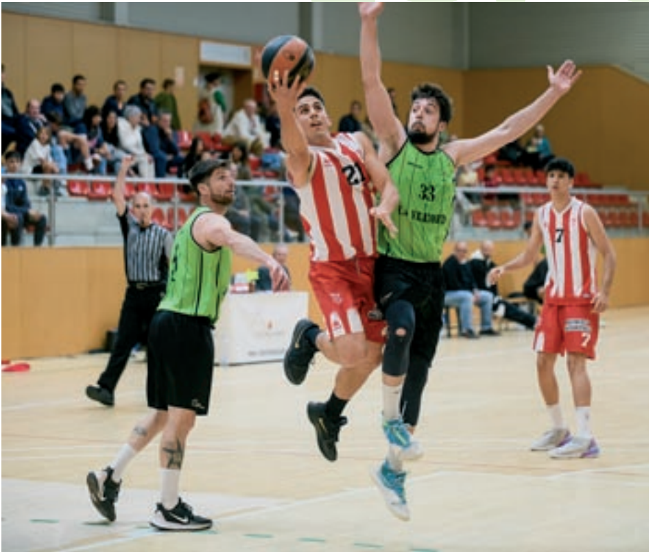
El Sènior 3 del Club Bàsquet Vic va assolir aquest diumenge el seu segon ascens consecutiu en el derbi amb el Vilatorça