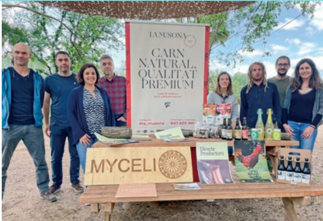
Els vuit impulsors de Directe Productors, amb una mostra de les seves elaboracions