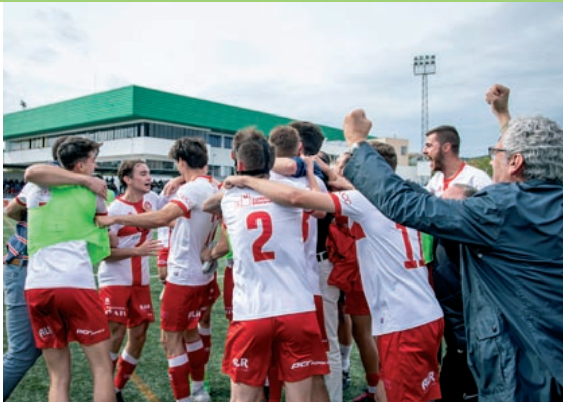
La plantilla celebrant el triomf al camp del Lloret i l'ascens de categoria al final del partit

GOLS: 0-1, min 8, assistència d'Ignasi Armengou que aprofita Flavio.