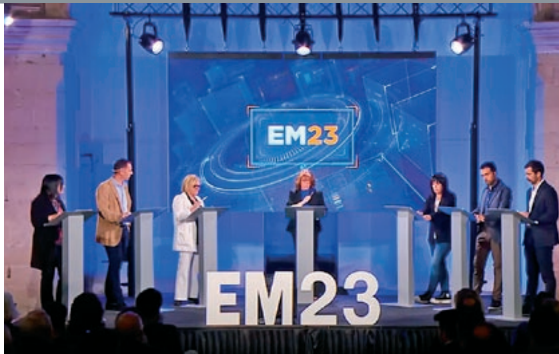
Una imatge del debat de la Televisió del Ripollès, dijous

L'acte va ser un caos de gairebé dues hores en què la valoració de l'últim mandat, l'exhibició de l'obra efectuada, els retrets entre uns i altres i unes propostes que en un altíssim percentatge acabaven sent transversals de totes les