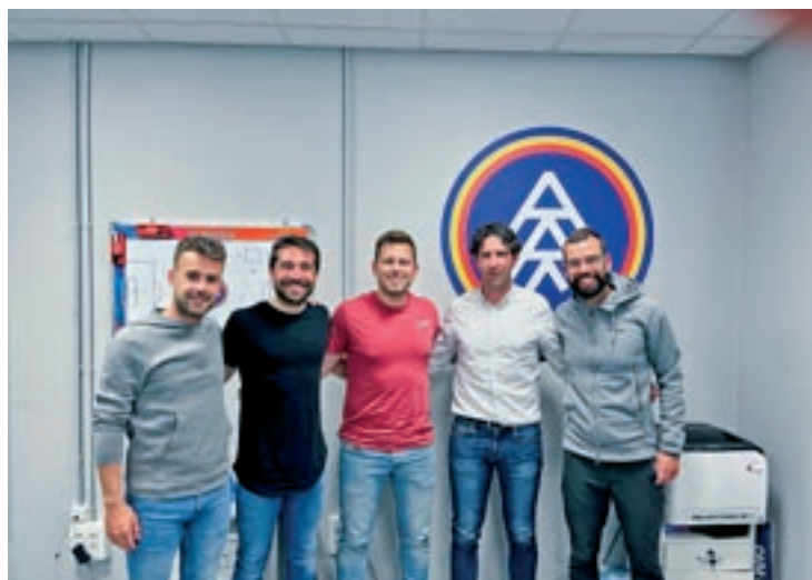
Representants de la UVic-UCC i del FC Andorra que han participat al conveni

mètodes de recuperació en l'àmbit del futbol. Aquesta col·laboració, iniciada enguany, però que s'espera que pugui tenir continuïtat, es durà a terme gràcies a un conveni de col·laboració entre les dues institucions i amb vigència fins al juny del 2024. L'acord parteix del fet que la recerca ha d'aportar avenços per a la salut i el benestar dels jugadors, un factor clau per assolir el seu