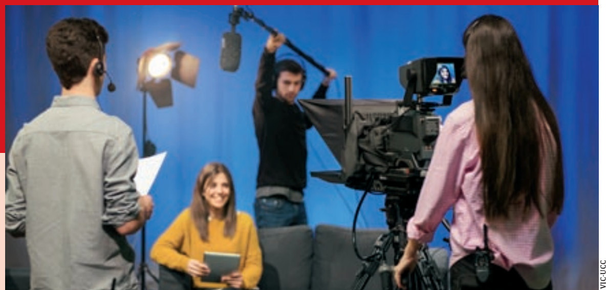
Els estudiants de Comunicació Audiovisual de la UVic-UCC

actes diversos durant tot el curs i amb la mirada posada en l'evolució constant d'aquest àmbit, que demana professionals polivalents. El Consell de l'Audiovisual de Catalunya (CAC) va escollir Vic per entregar els seus premis anuals.