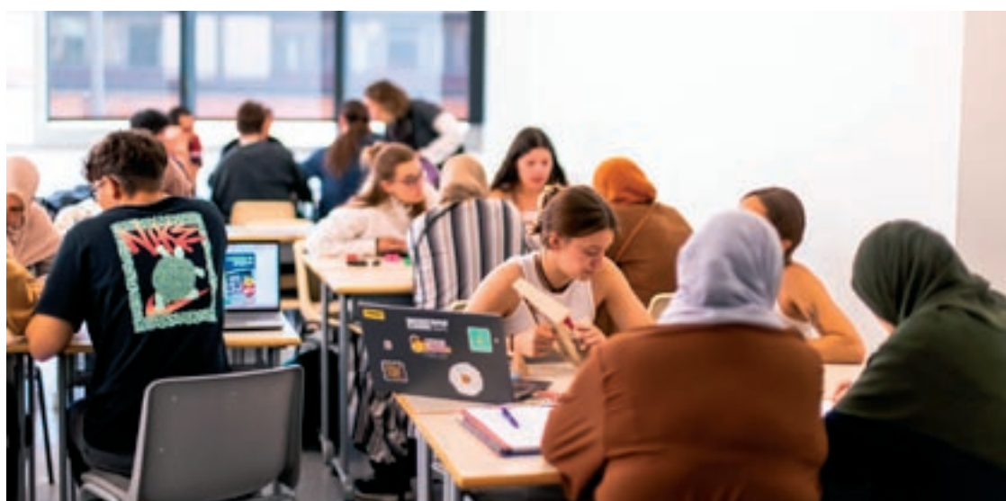
Els estudiants universitaris fan de mestres a alumnes de les escoles d’adults

Per portar a terme aquesta tasca i poder preparar els materials, els estudiants de mestre, dins l’assignatura de Didàctica de les Matemàtiques I, van fer una visita prèvia als centres per conèixer com es treballa en una aula amb alumnat adult. Un cop a la UVic, els alumnes es divideixen en dos grups de treball i se’ls assigna un estudiant de mestre a cadascun, que li serà el referent per a les tres sessions. Treballen sumes i restes a partir de l’acte d’anar a comprar, tor-