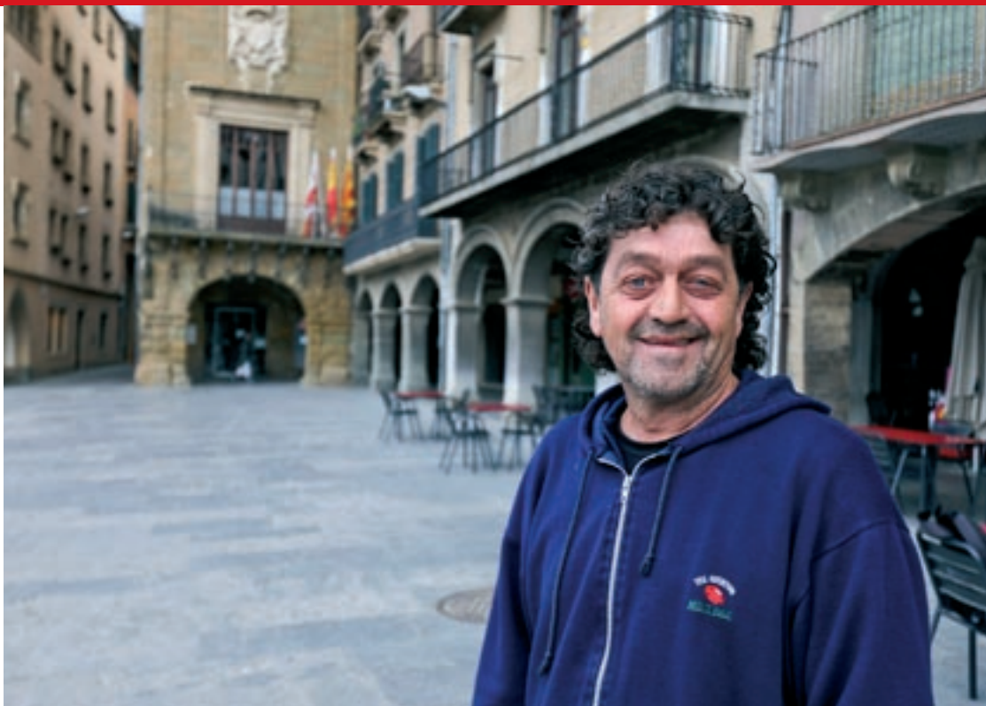
Després d'haver dut a terme projectes arreu del món, Erra va tornar a Catalunya per continuar la seva labor

L'educador recorda els seus anys d'estudiant amb molta estima: “Crec que van ser fonamentals per a la meua carrera en el sector social”. I és que un cop acabada la carrera universitària, Erra es va endinsar en el sector social i aviat li van proposar un contracte en un centre de protecció de menors a Vic, on va treballar molts anys com a educador. És a partir d'aquesta experiència que va decidir continuar treballant