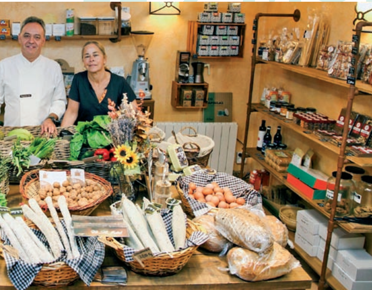
dels productes amb segell del Moianès