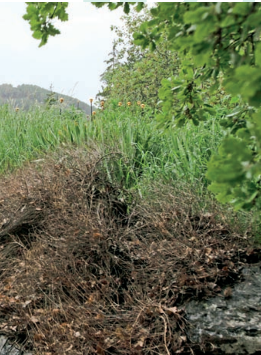
plantat i una fotografia d'ell