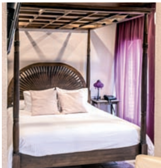
Hotel La Violeta & el seu Baluard****