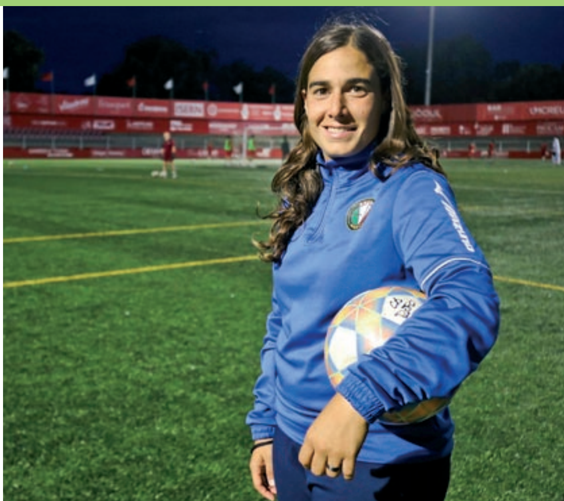
Arnaus, la setmana passada, a l'estadi Hipòlit Planàs

En els dos equips més competitius, que serien el 3RFEF i el Juvenil de Preferent, que tenen l'objectiu de salvar la categoria i intentar quedar el millor possible, aquí deixem llibertat als entrenadors sempre que hi hagi un tema de valors i respecte que va a tot arreu. En tot el que seria la base i formació la filosofia és intentar ser protagonistes amb la pilota des d'un inici. No he pensat mai que el futbol defensiu a darrere i el fet de sortir a la contra sigui atractiu i m'agrada proposar això, però els entrenadors han de ser capaços d'identificar quines jugadores tenen i com en poden treure el millor rendiment. Però sobretot, tenir el protagonisme amb la pilota.