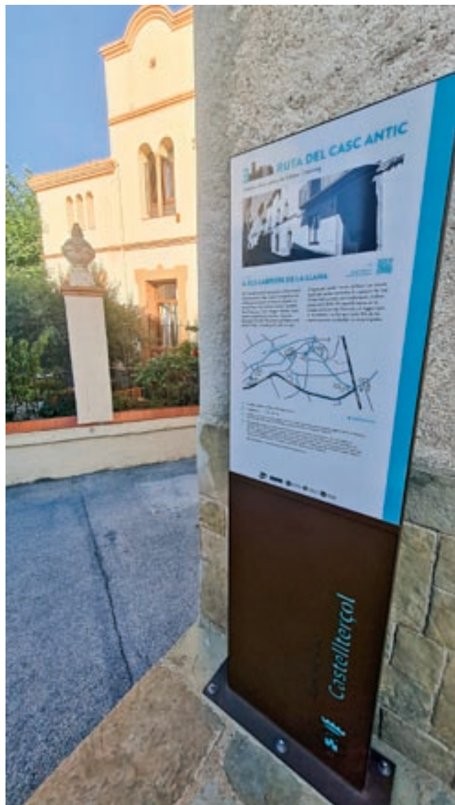
Exemples de les excursions: a dalt, a Sant Júlia d'Úixols; a sota, sobre la imatgeria festiva de Castellterçol. També un dels plafons que senyalitzen l'itinerari pel nucli antic