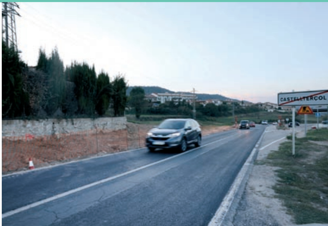
En un tram de més de dos quilòmetres als termes de Sant Feliu i Sant Quirze es farà un separador de fluxos central

L'actuació de millora de la C-59 ja és visible en diversos punts. S'està treballant en l'apedaçat del ferm en els punts on estava més malmès. Aquesta feina es vol tenir avançada abans de l'arribada del fred, que no permet fer aquestes tasques. Comporta "restriccions de trànsit que van canviant cada setmana", diu Malavia, que recorda que