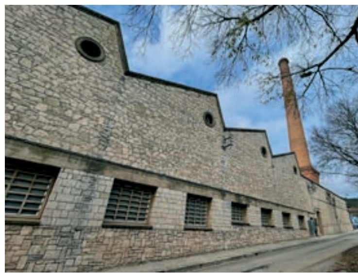
L'antiga fàbrica tèxtil de Can Comadran, en una imatge d'arxiu

de Jofre Torras, va acusar el govern d'ERC d'engegar el projecte "amb presses i sense haver pogut treballar-lo". Al seu entendre, el pla d'usos "hauria d'estar fet": "Són les qüestions que anem deixant enrere i llavors fem les coses malament." També pateixen pels calendaris: "Ens fa molta por que no presentem tots els papers a temps o que, un cop començades les obres, no arribem a termini, ens anul·lin la subvenció i haguem de pagar tots els diners."