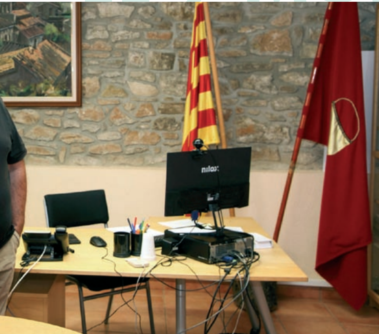
promís Municipal. Del 1999 a 2003 va ser alcalde pel PSC