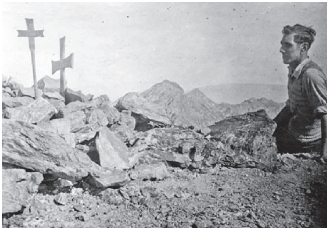
IMATGES QUE SÓN HISTÒRIA Dues excursions del Grup Excursionista Fills del Ter (1930-39). A dalt, la vagoneta-funicular anant a Capdella, a la Vall Fosca; a baix, un dels excursionistes al cim del Noucreus