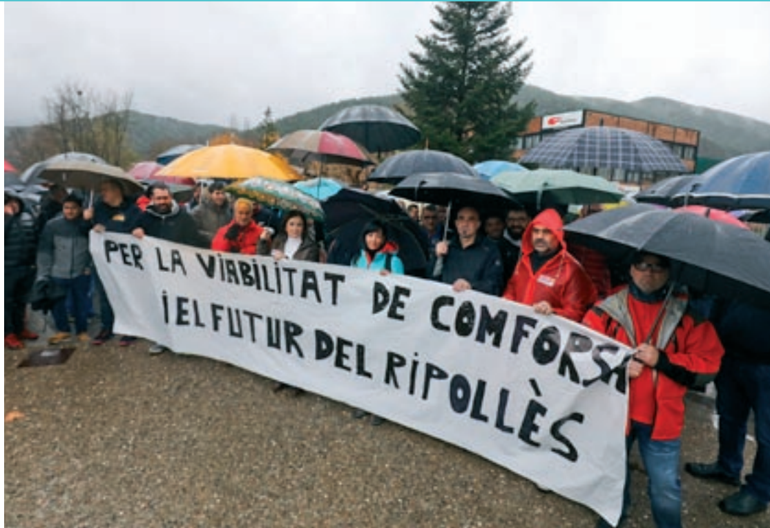
La concentració de divendres, amb treballadors davant de la factoria Comforsa 4 de Campdevàrol

Els talls de la carretera, que també es van reproduir diumenge de 6 de la tarda a 8 del vespre, van ser les accions de major impacte, ja que van coincidir amb l'horari que els vehicles de segona residència o bé la gent que va a passar el cap de setmana a hotels, apartaments turístics o albergs de la comarca o de la Cerdanya solen transitar per arribar a marxar a l'àrea metropolitana. La reacció d'alguns conductors "va ser la normal en aquesta mena de concentracions, d'empenyada amb els autors