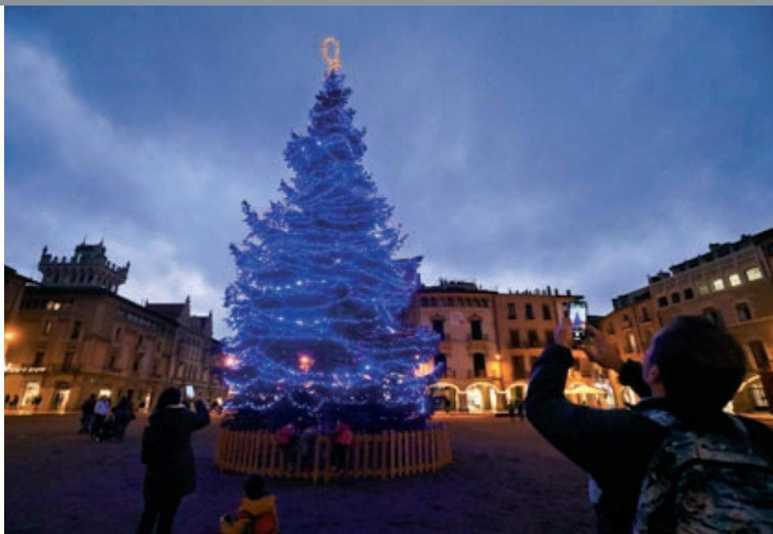
LA FOTOGRAFIA De ben segur que una de les fotografies d'aquests dies serà la de l'arbre 'blau' de la plaça Major. Divendres es van encendre els 400 llums de Nadal que hi ha repartits per tota la ciutat, amb un cost de 30 euros per dia

La fira s'acompanya de l'habitual ventall d'activitats i espectacles d'ambientació. Com a novetat, a la zona de les Adoberies, hi haurà un campament de recreació històrica medieval. En