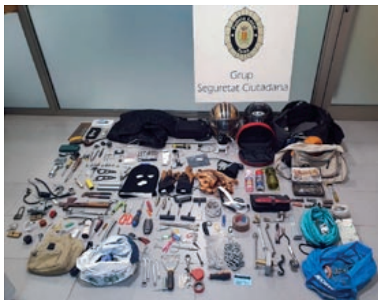
Material que hi havia a dins de la motxilla

Planoles Osona Acció Social organitza una nova edició de les seves colònies d'hivern, que enguany tindran lloc del 27 al 29 de desembre a Planoles, al Ripollès, i amb activitats a La Molina. La iniciativa s'adreça a infants i joves de 10 a 15 anys i pretén oferir-los un entorn lúdic, a banda de facilitar la conciliació familiar durant les festes.