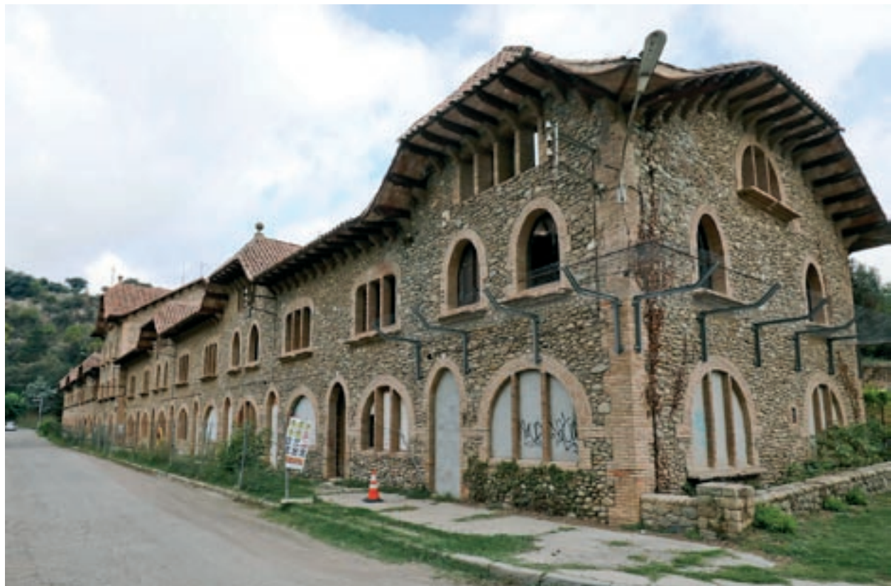
Imatge de la façana de la colònia Ymbern

L'any 1970 la colònia comptava amb 144 habitants, però a partir de 1975 els treballadors van