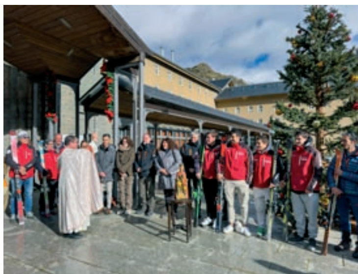
‘Benedicció’ dels esquiadors de Núria Aquest dissabte va tenir lloc la tradicional benedicció d'inici de la temporada d'esquí a Vall de Núria

els caps de setmana) i el complex presenta un munt de novetats com un nou restaurant de cuina catalana amb producte de proximitat –El Racó de la Vall–, una activitat d'observació del cel a càrrec del Parc Astronòmic del Montsec o la instal·lació d'un canviador inclusiu per a persones amb mobilitat reduïda a la terrassa de la base de l'estació. Enguany se celebrarà també la segona edició de la proposta “El Nadal a Vall de Núria”, i en poc temps està previst posar en marxa un nou espai de benvinguda amb un punt d'informació del Parc Natural de les Capçaleres del Ter i del Freser a l'arribada del cremallera. La relacions públiques i cap