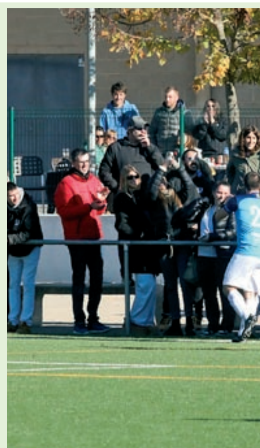
Els jugadors del Sant Julià celebren el gol de la victòria