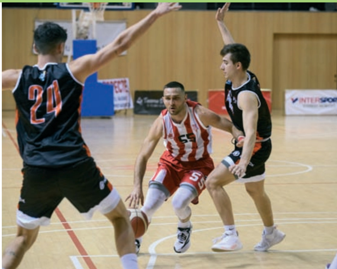
El jugador del CB Vic Oliver intenta superar dos rivals

Els vigatans van sortir a la pista amb una gran intensitat, conscients de la gran oportunitat a casa per emportar-se la victòria i recuperar les bones sensacions. Per altra banda, l'Al-