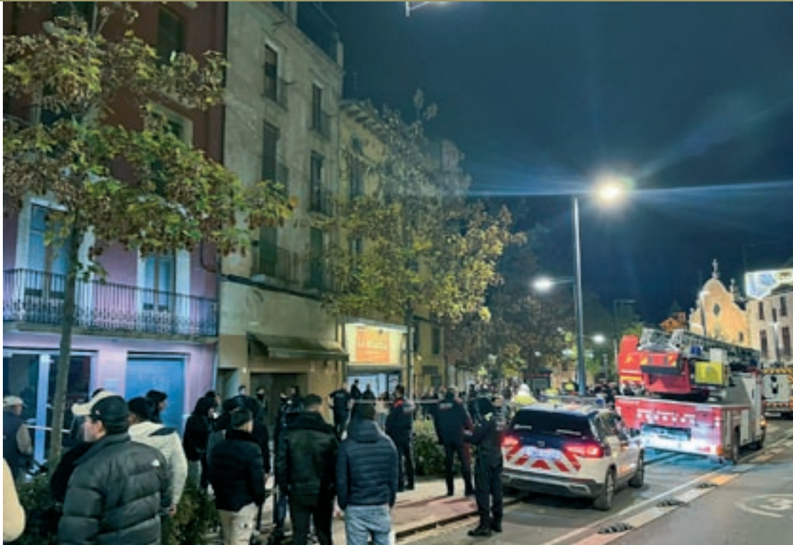
El desallotjament es va allargar pel mal estat de l'edifici i va generar molta expectació a la rambla Hospital

Un cop extingit el foc i desallotjat l'espai, es va permetre a algunes persones recollir les seves pertinences abans de bloquejar i tapiar l'accés a l'entrada. Hi vivien una desena de persones en situació irregular. Es van desplaçar al lloc dels fets tres dotacions de Bombers, dues de Mossos d'Esquadra i tres de la Guàrdia Urbana de Vic.