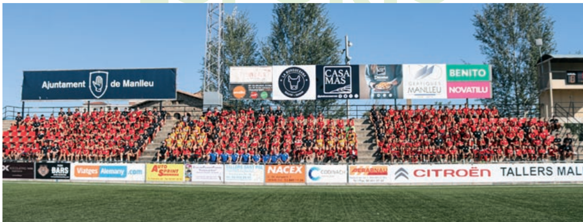
Foto dels equips del club AEC Manlleu, el dia de la presentació, a mitjans d'octubre