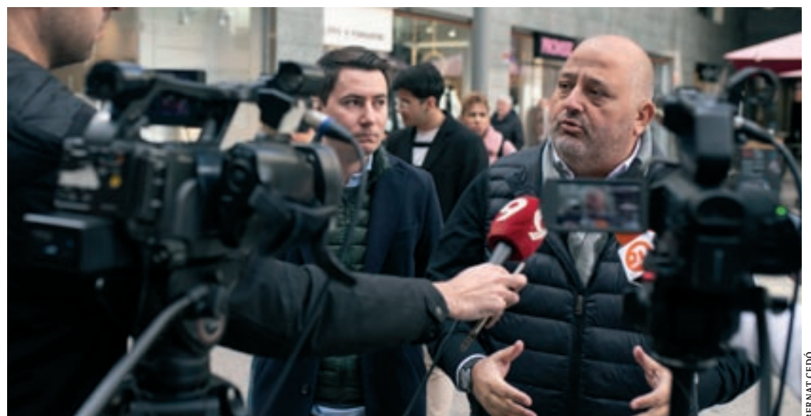
El diputat del Partit Popular al Congrés Agustín Parra va participar a la trobada comarcal del partit a Vic

L'alerta a la Policia Local per l'intent de robatori la va donar un veí de Tona després de detectar que dues persones estaven fent algunes maniobres sospitoses. Des del cos policial, agraeixen la col·laboració ciutadana, imprescindible en aquesta actuació, i recorden la importància d'avisar-los sempre que algun veí identifiqui "qualsevol actitud o situació poc comuna".