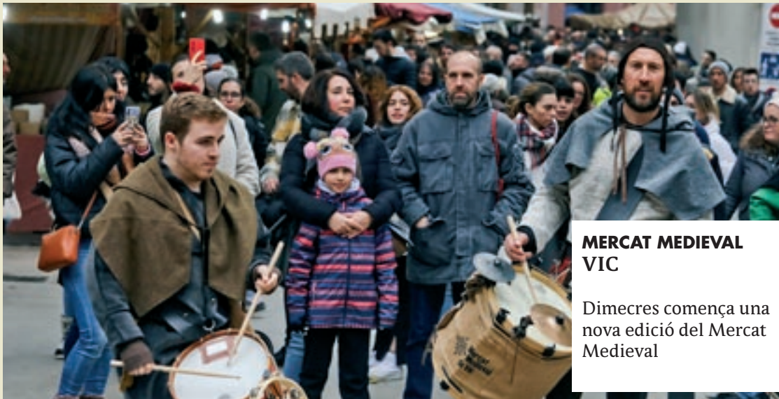
MERCAT MEDIEVAL VIC

Cau de les Bèsties. Descobrirem diferents activitats connectades amb l'exposició temporal "Bèsties". Des de crear una bèstia pròpia fins a fer una petjada amb fang. De 3 a 12 anys. MEV. 17.00.