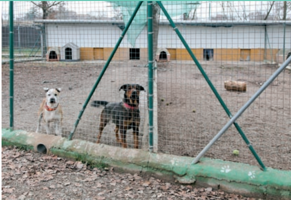
Dos gossos al Centre d'Acollida d'Animals Domèstics de Moià, que passarà a dependre del Consell Comarcal

"El servei i el voluntariat són els dos eixos del projecte i per això volem que les enti-