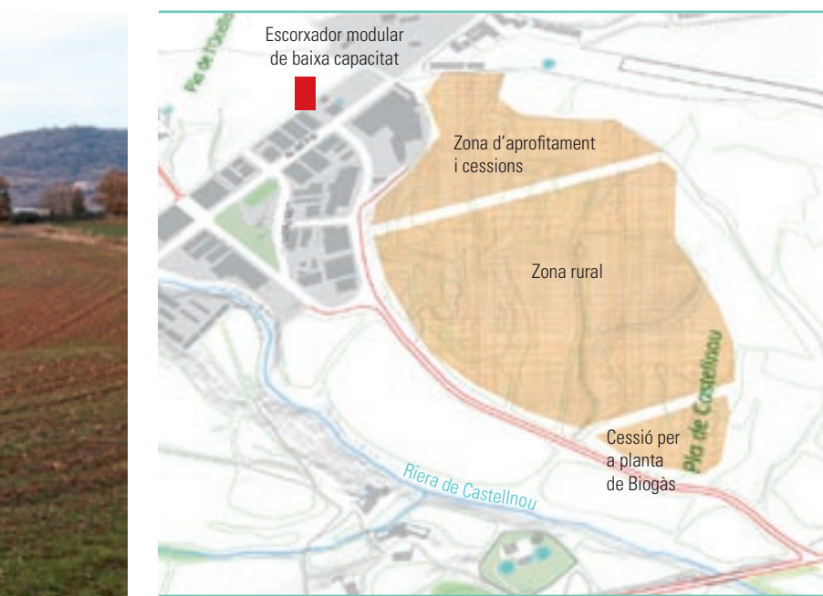
SEBASTIÀ RENOM / JOSEP FONT / NEUS PÀEZ