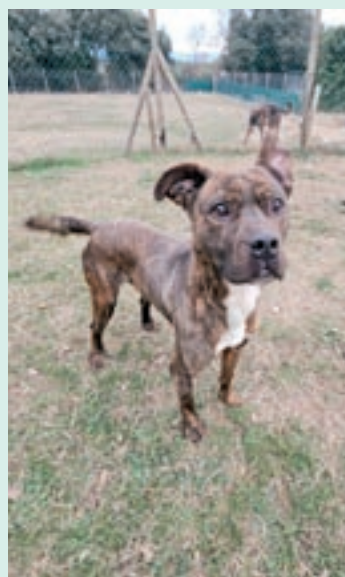
Un gos al centre de Caniausa

forma voluntària. I defensa la seva eficiència. "És important arribar al màxim de gent possible i mirem de donar en adopció el màxim d'animals". Els animals arriben al centre després de rebre un avís dels ajuntaments amb qui tenen el servei contractat. "Si tenen xip, és possible que els animals els hagin perdut i mirem de