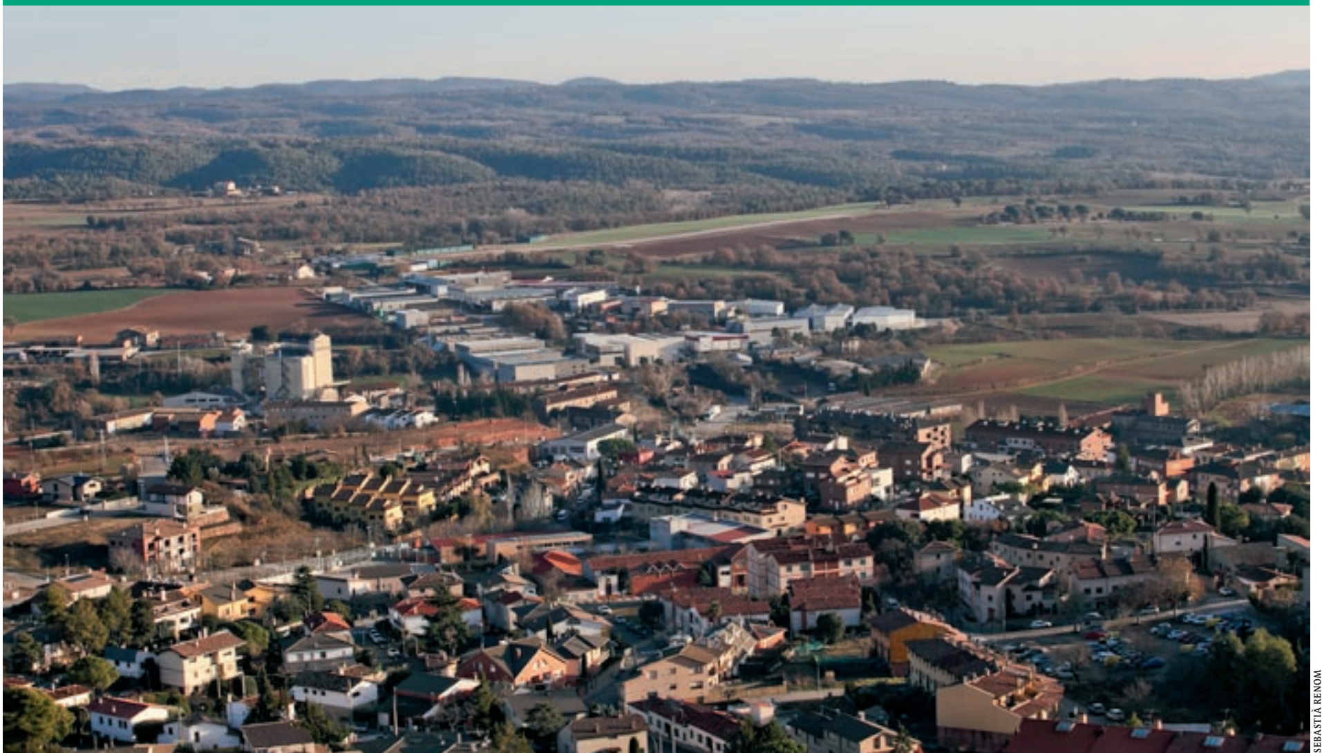
(Pàgines 2 i 3) Vistes de Moia, amb el polígon El Prat i l'escorxador comarcal al fons

Les cessions per part de l'empresa han de permetre construir la futura planta de biogàs i posar ordre al polígon