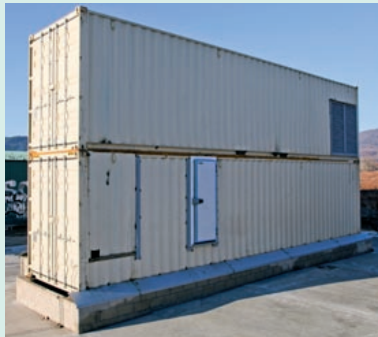
L'escorxador de baixa capacitat. S'hi podran tractar uns 1.500 quilos al dia

L'escorxador de baixa capacitat permetrà sacrificar els animals de forma directa, propera, més