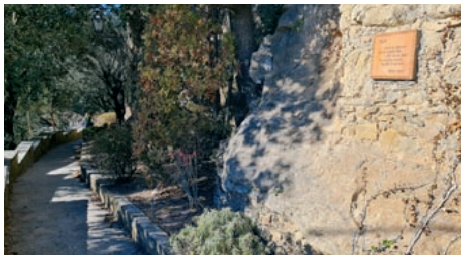
Vistes en fer la ruta, que permet veure des de Montserrat fins als cingles de Bertí, Barcelona o el mar; a la dreta, l'edifici de Puig d'Olena i detalls del camí, amb una placa amb versos de Torres