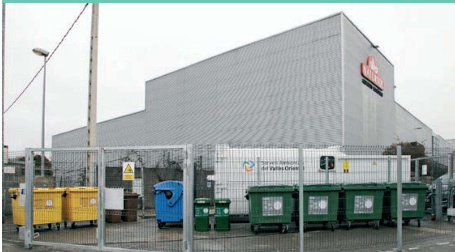
La nova àrea d'emergència, tancada, per als veïns del poble

S'ha creat una àrea d'emergència per als veïns tancada per evitar abocaments incontrolats