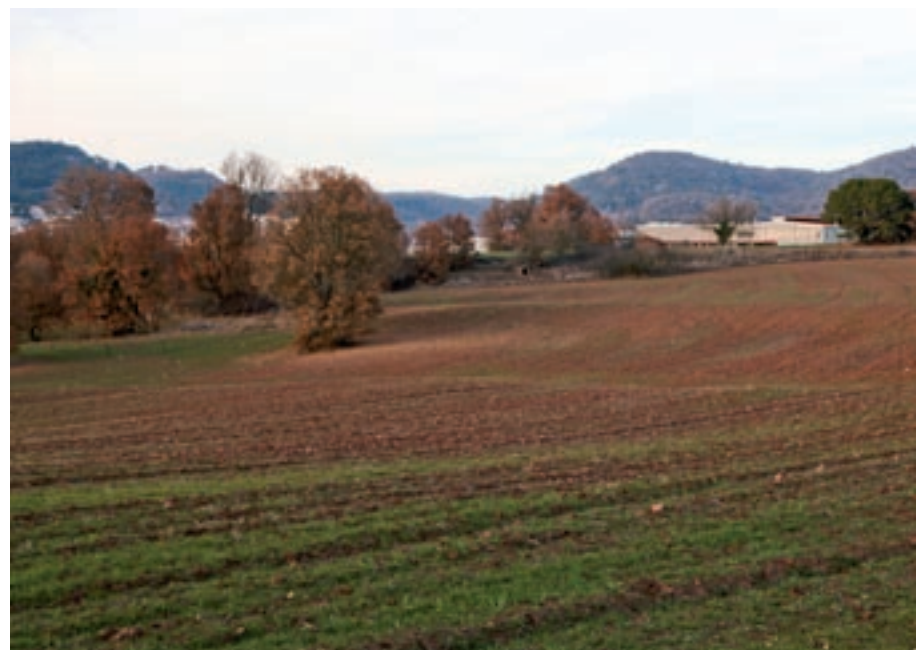
A dalt, vistes de Moià, amb el polígon El Prat i l'escorxador al fons; a sota, part dels terrenys que

serà un 80% de la producció energètica. El 20% restant serà a benefici de particulars del municipi, amb la creació d'una comunitat energètica.