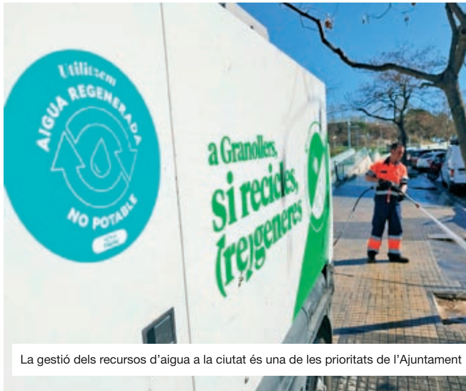
La gestió dels recursos d'aigua a la ciutat és una de les prioritats de l'Ajuntament

Amb aquesta estratègia, fa més de dues dècades que l'Ajuntament de Granollers aposta per la regeneració