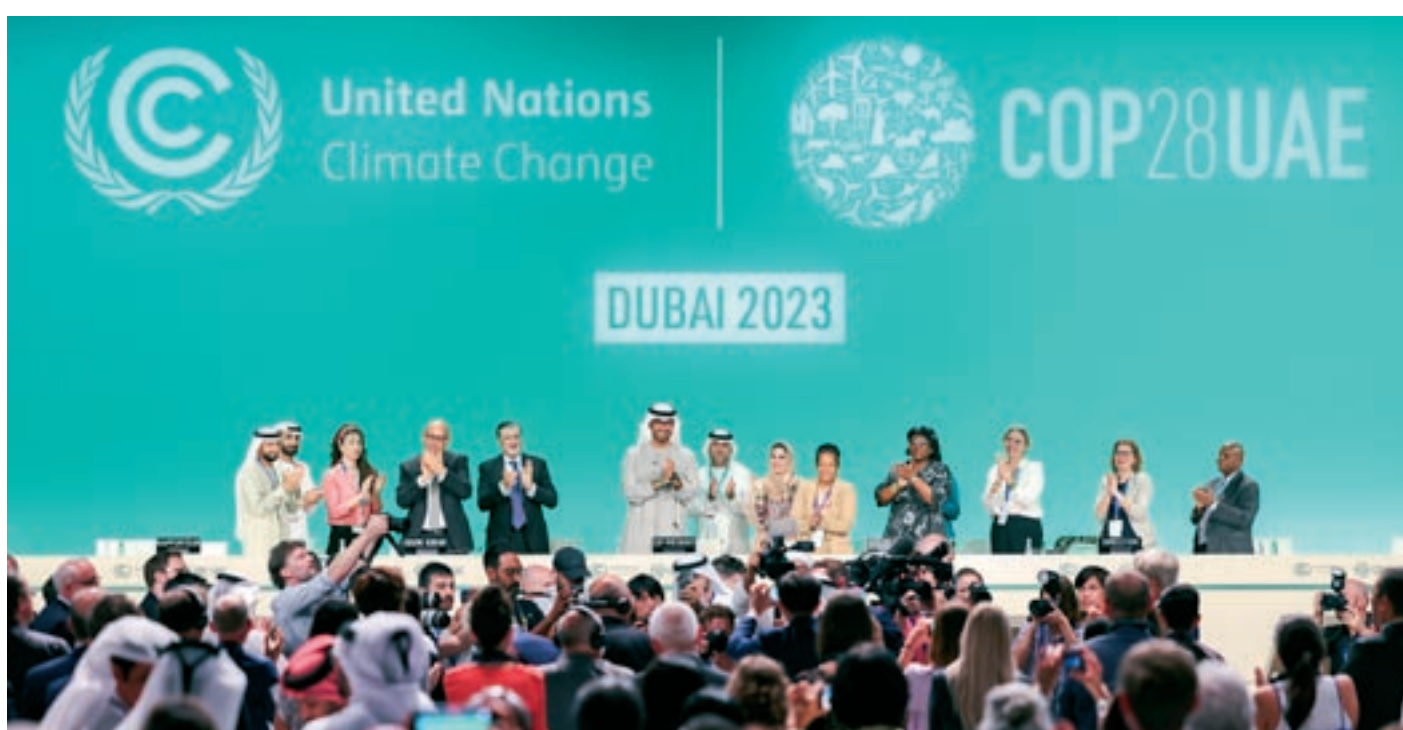
A dalt, el secretari general de l'ONU, António Guterres, parla amb la premsa a l'Expo City, seu de la COP28 a Dubai.