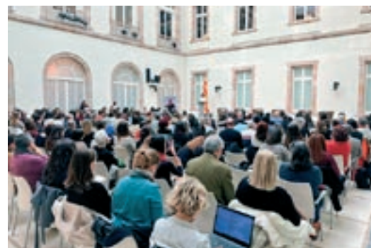
A l'esquerra, un moment de la II Jornada de la Pau del Parlament

El Fòrum Català per la Pau és una iniciativa impulsada pel govern de Catalunya, el Consell Català de Foment de la Pau, l'ICIP i el teixit