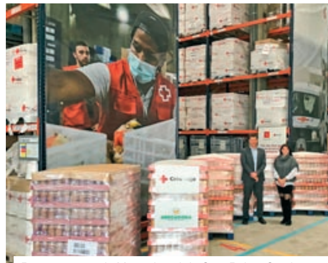
Representants de Mercadona i de Creu Roja a Catalunya durant l'entrega de productes de primera necessitat