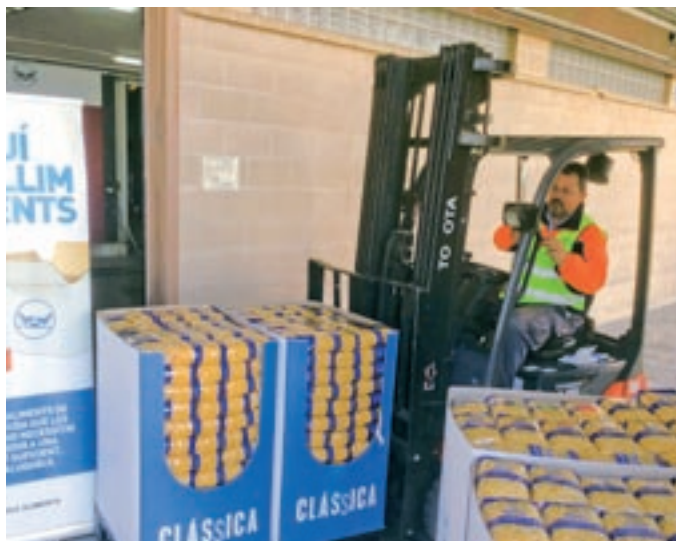
Donació de macarrons al Banc dels Aliments de Barcelona

A l'edició 2023 del Gran Recapte, la companyia va posar a disposició del projecte un total de 1.632 botigues (250 de les quals a Catalunya) en què va dur a terme diverses activitats de coordinació i comunicació perquè els clients poguessin fer les donacions monetàries en passar per les caixes en el moment de la compra. "Advoquem per aquesta modalitat perquè permet adaptar les donacions a les necessitats reals dels beneficiaris", explica Cruz, ja que els bancs d'aliments "poden adquirir els productes que necessiten, en les quantitats oportunes i en el moment en què els necessiten" i així "en multiplica l'eficiència", conclou. Actualment totes les botigues de Mercadona a Catalunya donen productes diàriament a entitats socials i organitzacions benèfiques. Un altre aspecte rellevant