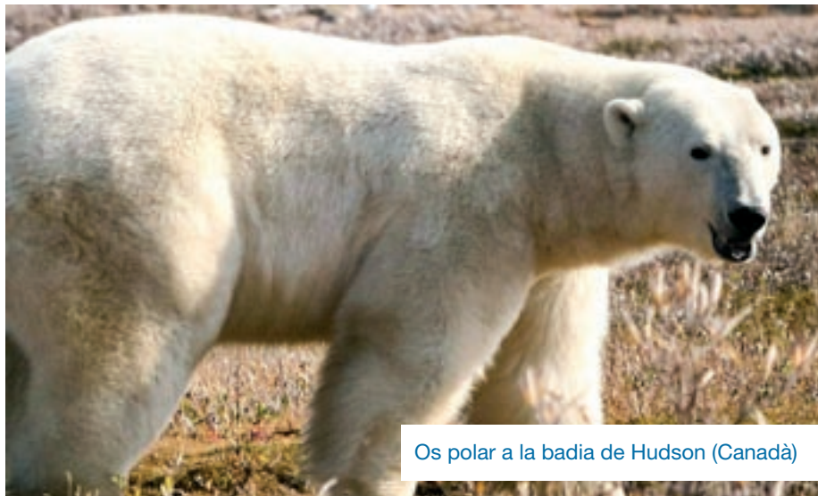
Oss polar a la badia de Hudson (Canadà)

Els ossos polars poden patir un greu risc de morir d'inanició si els períodes sense gel en el seu hàbitat s'allarguen. És la principal conclusió d'un estudi científic publicat a la revista Nature Communications . En el treball "Estratègies energètiques i conductuals dels ossos polars sobre terra amb implicacions per a la seva supervivència en períodes sense gel", l'equip de científics va mesurar la despesa energètica diària, la dieta, el comportament, el moviment i la composició corporal de 20 ossos polars a l'oest de la badia de Hudson (Manitoba, Canadà) d'agost a setembre entre els anys 2019 i 2022. Els animals van consumir baies, herba, algues, cadàvers d'aus, ossos, banyes de caribú, foques i belugues. L'equip d'investigació assenyala que, si bé aquests animals mostren una gran plasticitat conductual, l'alimentació terrestre els va aportar pocs beneficis, ja que 19 dels 20 ossos varen perdre entre el 4% i l'11% de massa corporal. Els científics apunten que "els recursos terrestres en aquella regió i estació són inadequats per prolongar el període en què els ossos polars poden sobreviure a terra". Un fet que reforça el risc d'inanició d'aquests animals, sobretot els joves,