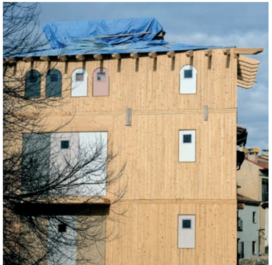
A dalt, un moment de la trobada per a la constitució de la Taula de la Fusta. A sota, una casa de fusta en construcció al carrer Sant Pere de Vic

moment, compten amb 200.000 euros de finançament del Ministeri per a la Transició Ecològica. La intenció és implantar noves produccions i aplicar noves tecnologies per millorar la rendibilitat de les activitats agràries.