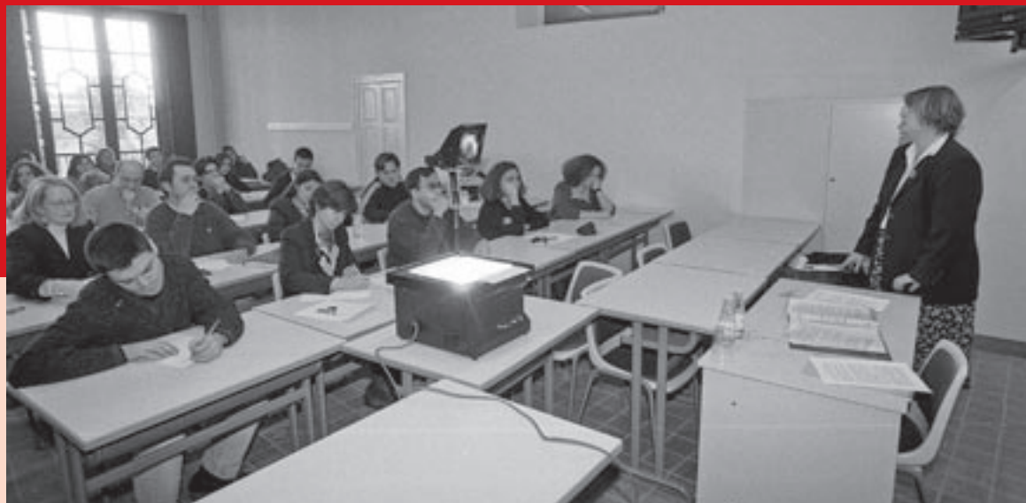
Una classe per als primers estudiants de doctorat de la Facultat de Traducció, a les dependències del Palau Bojons l'any 1998

cia, en col·laboració amb la UOC, i s'ha anat adaptant als canvis de la professió, que viuen ara una nova etapa amb el repte de com treballar amb la intel·ligència artificial. Traducció es va ubicar al principi al rehabilitat Palau Bojons de Vic.