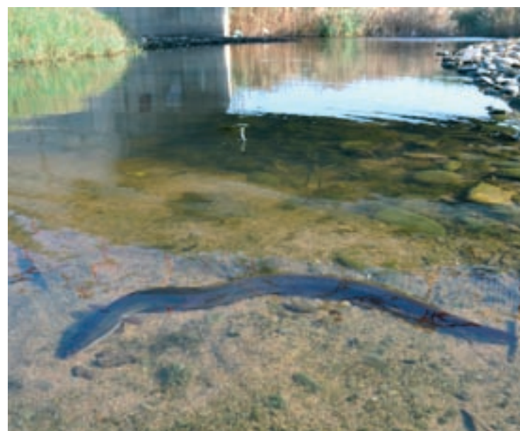
Anguila a la riera de Rubiés, al Port de la Selva

el projecte "Estat sanitari de les anguiles europees d'estanys i cursos fluvials de la Mediterrània occidental: desenvolupament de mètodes no invasius d'estudi de fonts de contaminació i proposta de mesures de restauració". La recerca està coordinada pel Centre d'Estudis dels Rius Mediterranis (CERM) de la UVic-UCC –amb seu al Museu del Ter– i té una durada de tres anys. El projecte, AnguillaMed, amb un pressupost total d'1.641.168,60 euros, està cofinançat en un 65% per la Unió Europea per mitjà del Programa Interreg VI-A Espanya-França-Andorra.