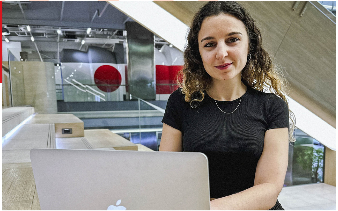
Martínez s’ha especialitzat i treballa com a dissenyadora d’experiències d’usuari (UX) i d’interfícies d’usuari (UI)

Aquesta formació multidisciplinària no va ser l’única cosa que li va agradar de la UVic, ja que Martínez també destaca “la possibilitat de fer diverses pràctiques i la mobilitat internacional, ja que durant la carrera vaig cursar-ne dues i vaig poder marxar d’Erasmus a Finlàndia”, diu. I és que precisament aquesta formació i pràctiques són les