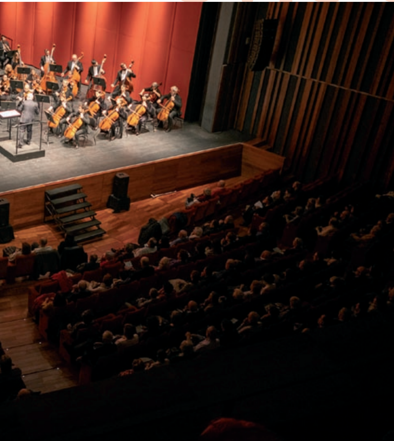
a del Liceu