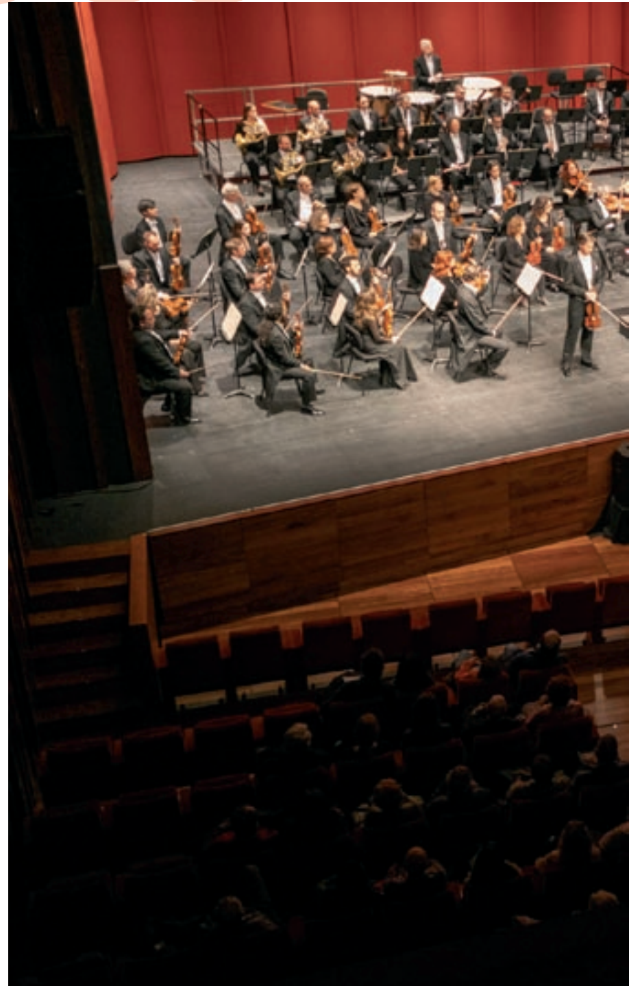
Un dels espais que més activitats ofereix és L'Atlàntida de Vic. A la foto, el concert de l'Orquestra

A més, afegeix que participar en aquests actes té els seus beneficis: "En el cas dels estudiants vam optar per l'opció de reconeixement de crèdits. A mesura que assisteixen a les diferents activitats obtenen punts que s'acaben convertint en