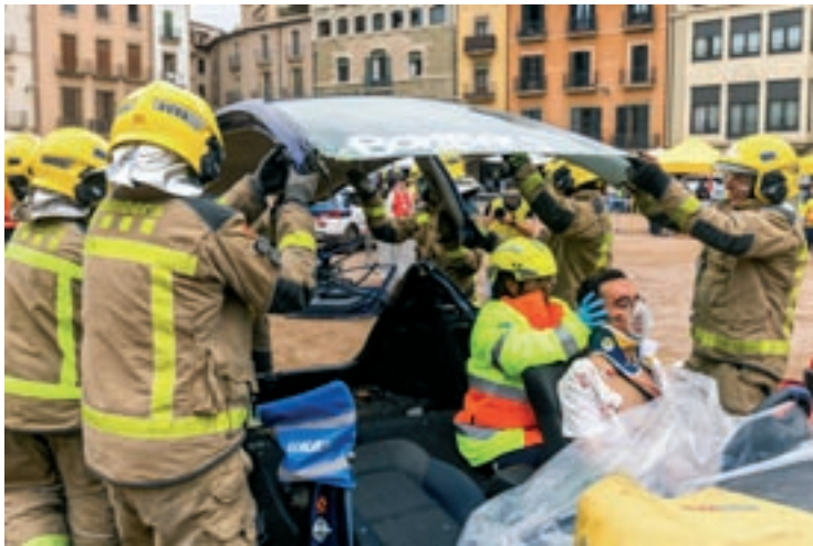
Bombers excarceren un ferit d'un dels vehicles implicats