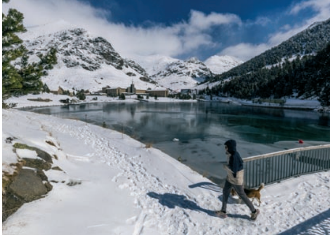
El complex de Vall de Núria, un dels beneficiats amb els fons europeus