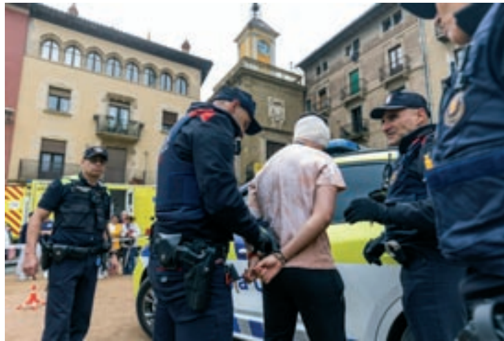
La policia acaba detenint el conductor del cotxe, que dona positiu en alcoholèmia