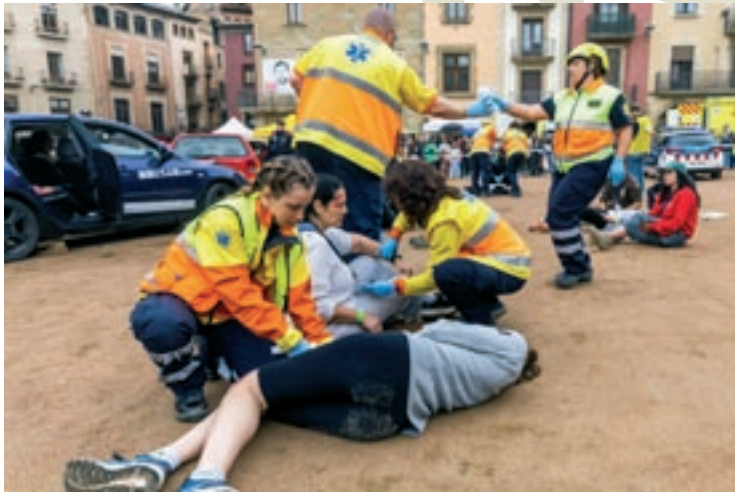
Personal del SEM fa la primera atenció als ferits en l'accident