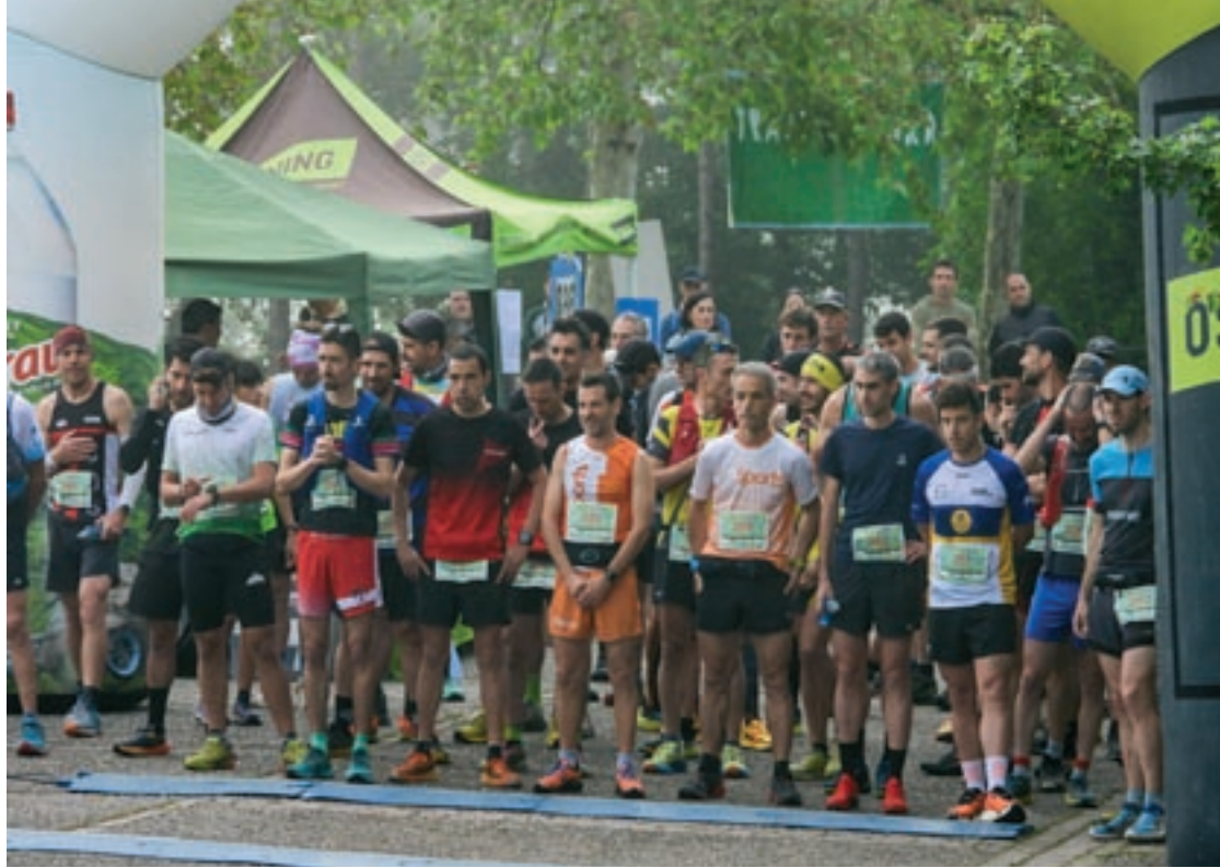
Els corredors, a la línia de sortida, a punt de començar la 4a edició del Trail de Sora