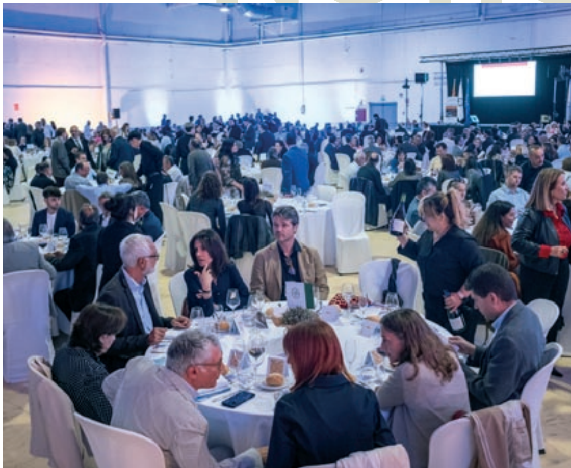
Un moment del sopar de divendres a la nit

Seran per a entitats d'atenció a la gent gran