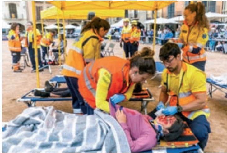
Se'ls trasllada a una àrea sanitària i se'ls divideix en funció de la gravetat