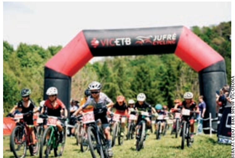
Diferents moments de la jornada viscuda dissabte a Vic, que va comptar amb ciclistes de totes les edats provinents d'arreu del territori català