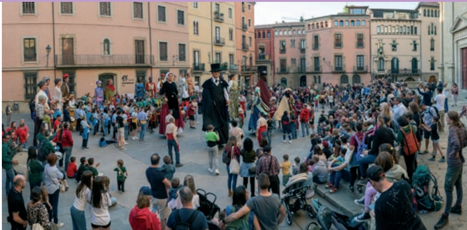
Moment de la ballada de bona part de les figures festives del barri, amb els gegants històrics al darrere, dissabte a la plaça de la Catedral

I en aquest barri del carrer de la Riera independent hi hauria diversos pilars d'interès nacional : com les seves festes; l'estesa de tallers d'artesanía que conformen el seu Punt d'Interès Artesanal –“és el que sempre m'he considerat, un artesà, perquè a més de fer coses boniques fan coses útils”, apuntava