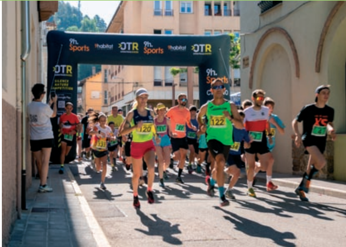
La cursa va comptar amb una vuitantena de participants entre els dos recorreguts