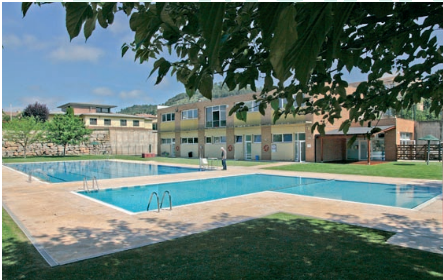
Les piscines municipals de Moià estaran obertes una hora més del que és habitual, fins a les 8 del vespre