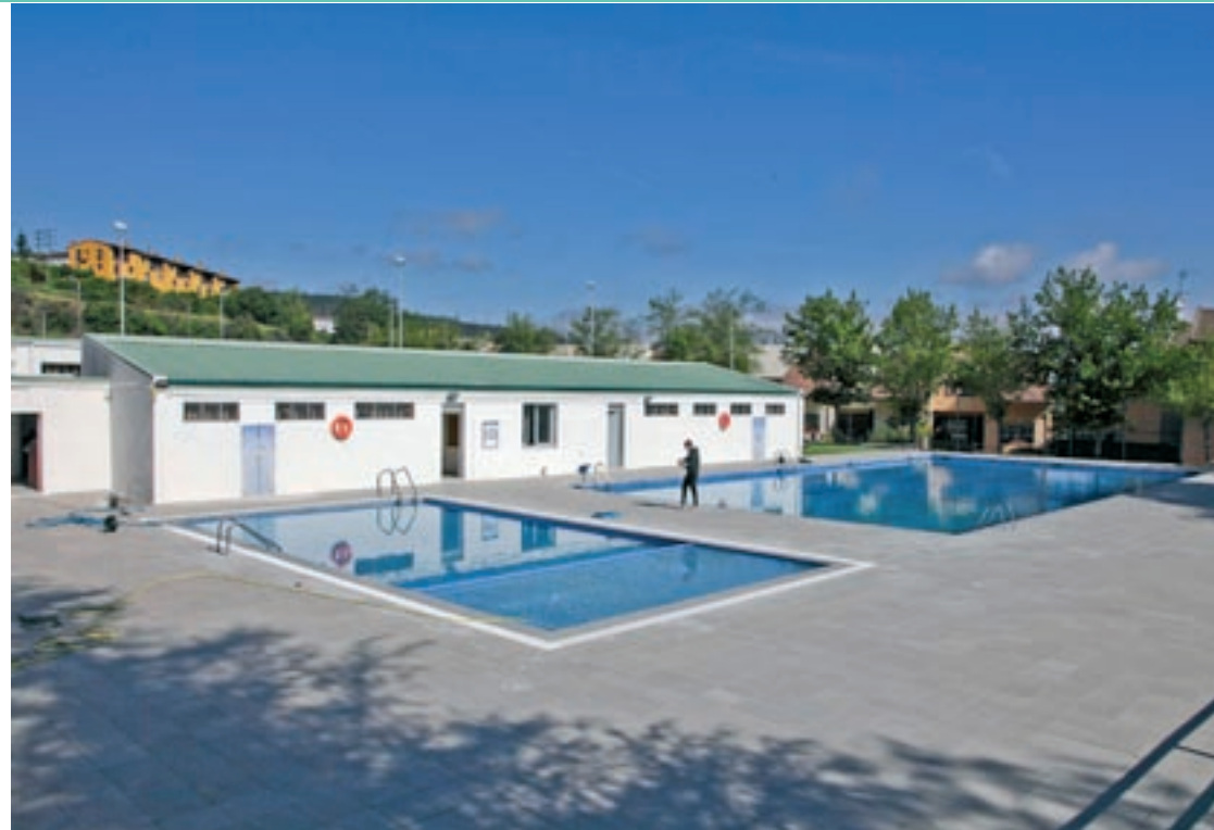
El recinte de les piscines de Castellterçol forma part de la xarxa de refugis climàtics del municipi

Una de les accions en les quals l'Ajuntament de Moià treballa és en la declaració de la piscina com a refugi climà-