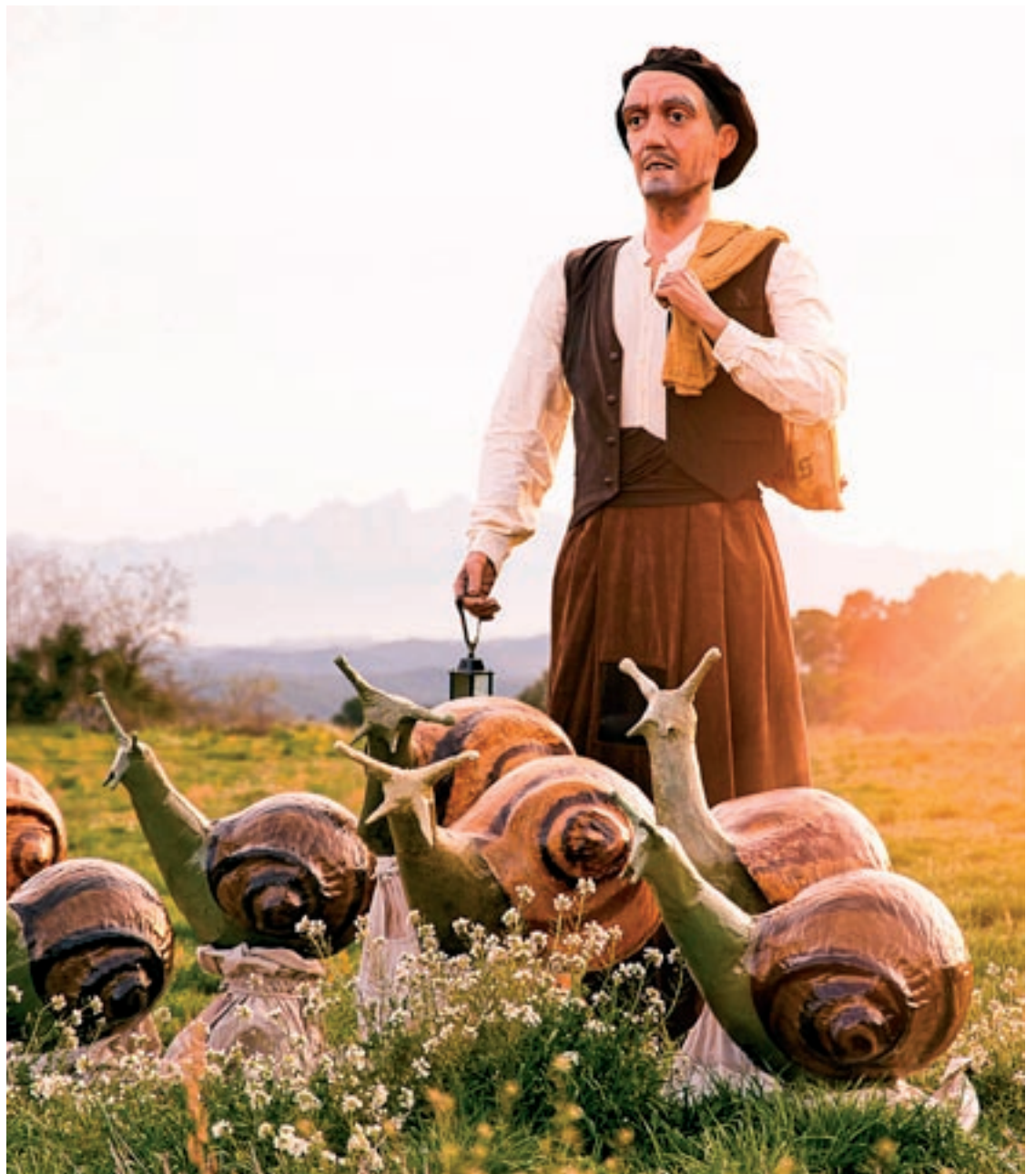
A dalt, els curiosos capgrossos en forma de cargol. A sota, la parella de gegants i a la dreta, en Miquelet sol, vestit de pagès i amb la llàntia i el sac