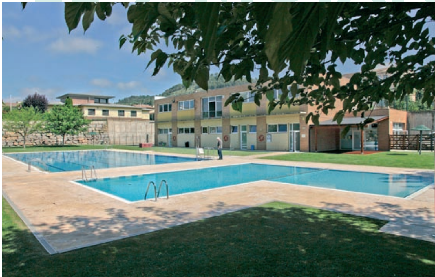
Les piscines municipals de Moia estaran obertes una hora més del que és habitual, fins a les 8 del vespre