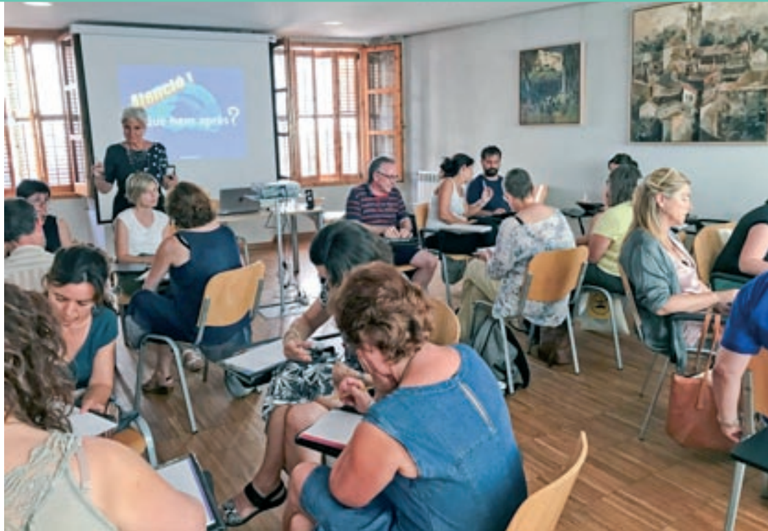
Una de les sessions de la universitat d'estiu del Moianès, que arriba als 10 anys