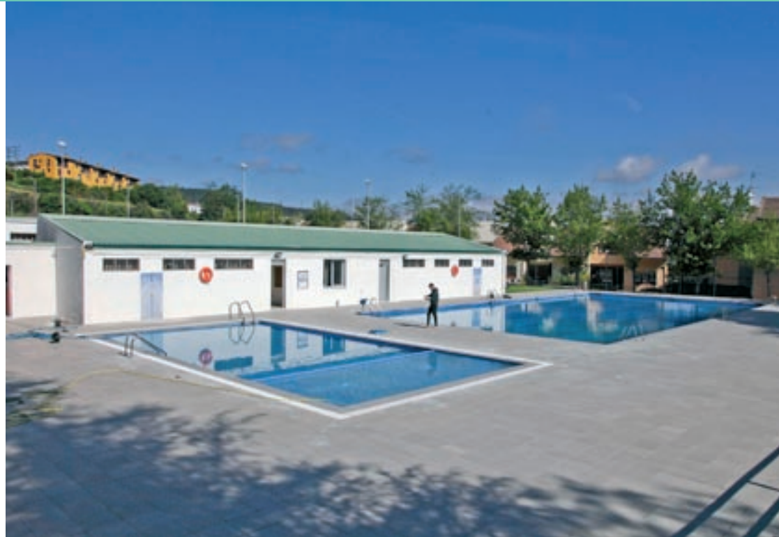
El recinte de les piscines de Castellterçol forma part de la xarxa de refugis climàtics del municipi

Una de les accions en les quals l'Ajuntament de Moia treballa és en la declaració de la piscina com a refugi climà-