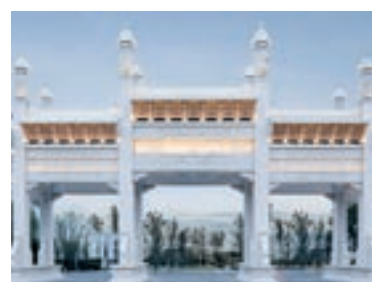
En gran, una imatge virtual del cementiri projectat a la Païssa. A la dreta, alguns detalls: l'estany amb una residència zen d'aigua, les sepultures del bosc i l'arc de benvinguda al recinte