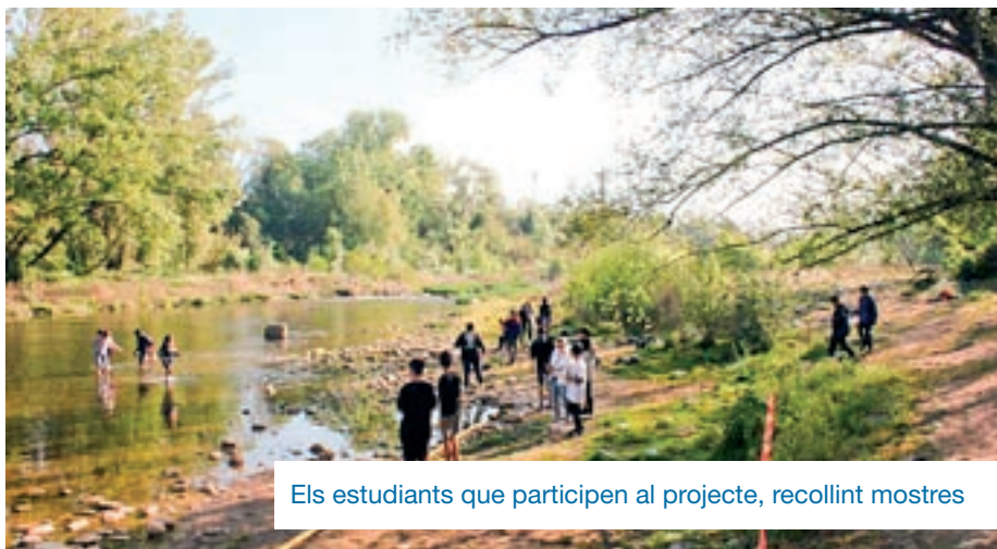
Els estudiants que participen al projecte, recollint mostres

dades de residus plàstics en l'àmbit europeu. Els joves utilitzen materials específics, com un kit de mostreig i un protocol, i apliquen tècniques científiques estandarditzades per analitzar la presència i tipologia de residus flotants a la ribera de rius i rierols.