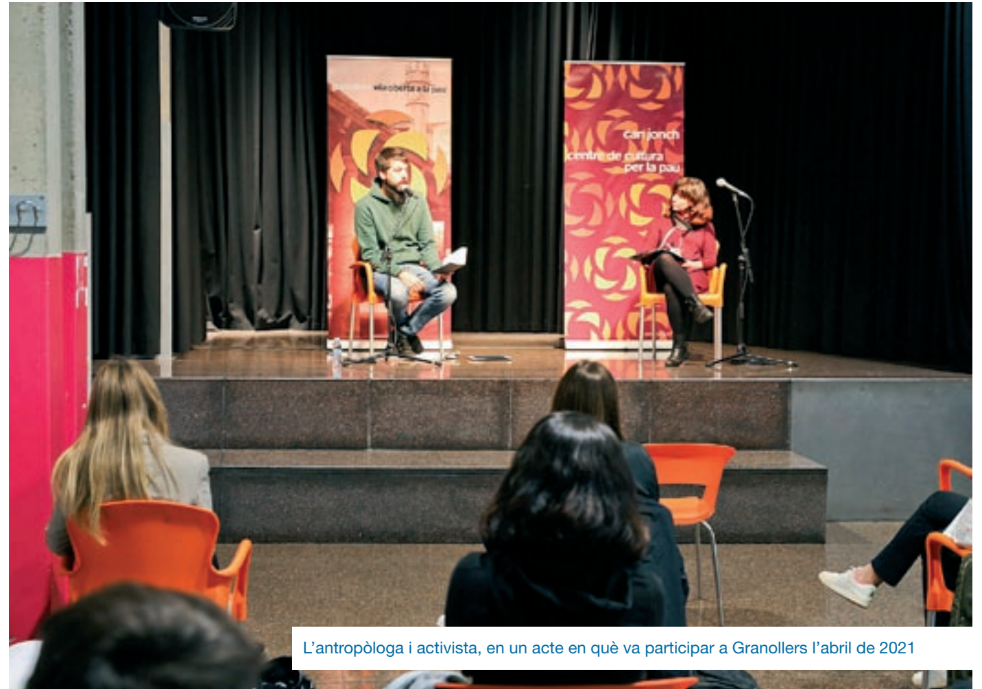
L'antropòloga i activista, en un acte en què va participar a Granollers l'abril de 2021