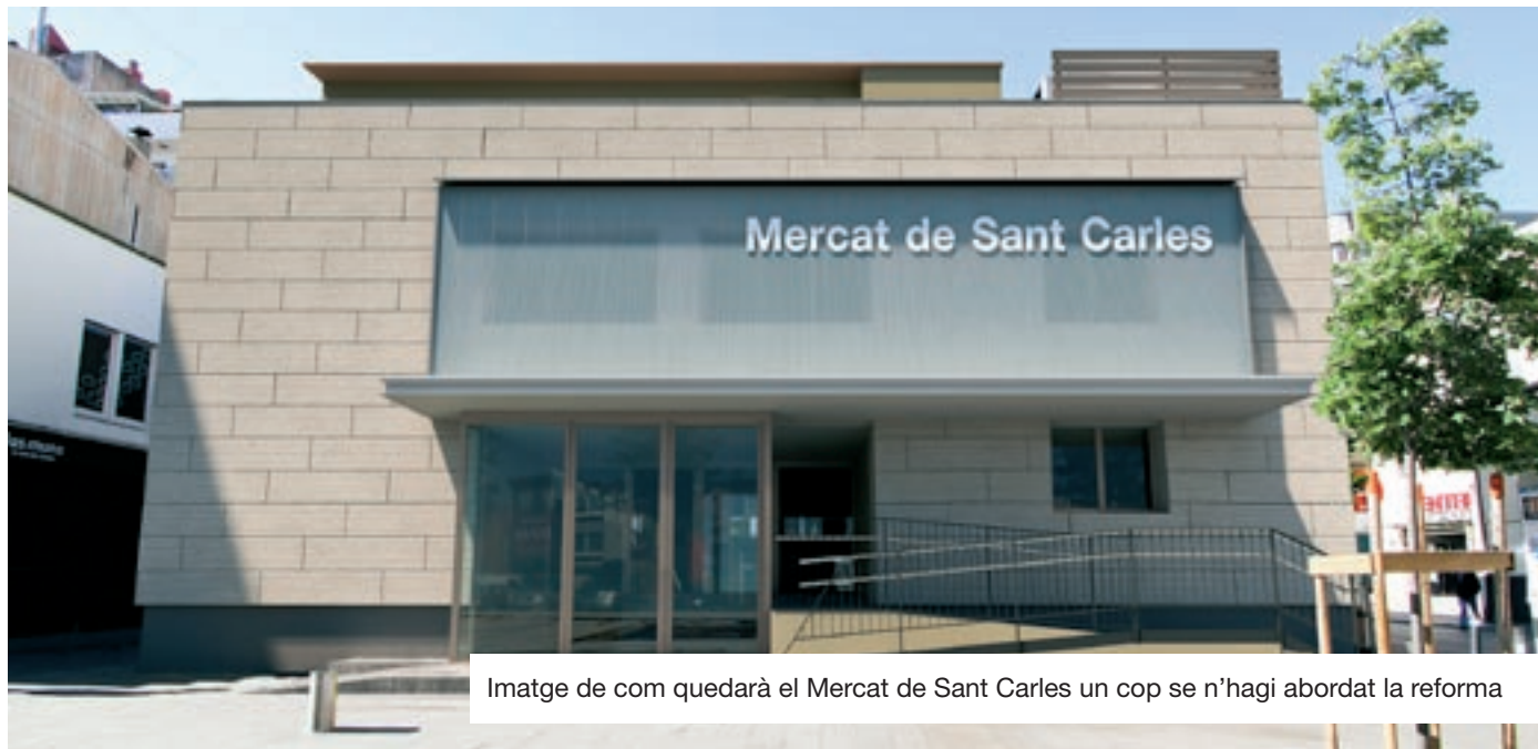
Imatge de com quedarà el Mercat de Sant Carles un cop se n'hagi abordat la reforma

Peix, carn i aus. Però també xarcuteria, fruita i verdura, pesca salada, llegums, menjar precuinat, pa i pastissos... Fa 56 anys que el mercat municipal de Sant Carles apuja persianes cada dia per oferir producte fresc, de qualitat i de proximitat, amb tracte amable, proper i personalitzat de les 36 parades que hi ha avui en funcionament. Un mercat singular que, situat al centre històric de la ciutat, és un punt de referència de compra i un dels espais més dinàmics de Granollers.