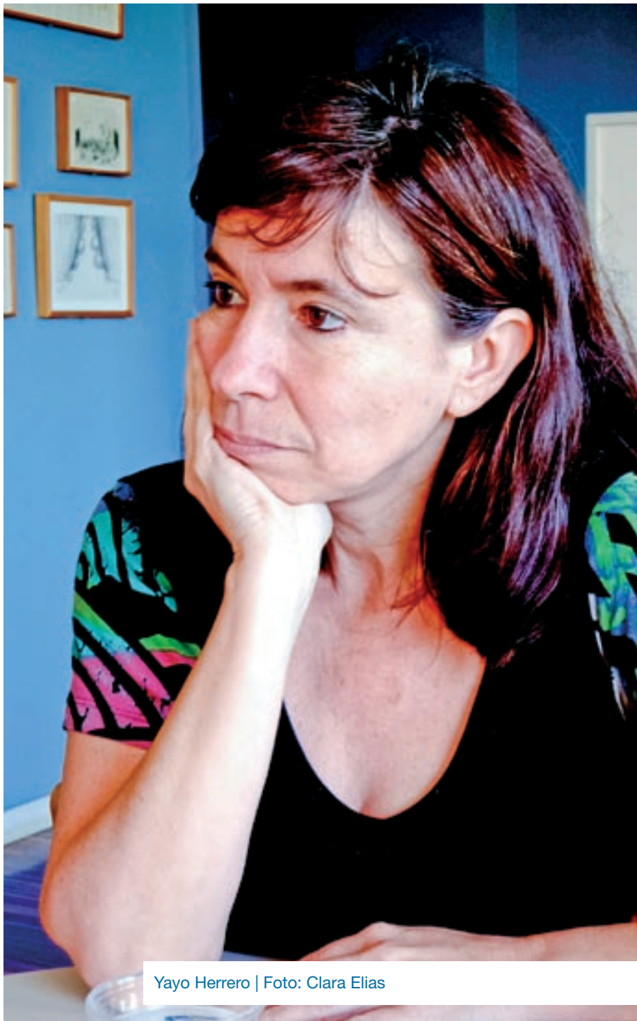
Yayo Herrero

Ens trobem davant d'una situació de policrisi profunda. Al meu entendre, insuficientment abordada i compartida amb el conjunt de la ciutadania a escala global, tant pels sectors més progressistes com pels més conservadors. Estic parlant d'una crisi ecosocial que ve marcada pel canvi climàtic, per l'esgotament de recursos bàsics i pel desbordament dels límits físics del planeta. Una crisi que, inevitablement, per ser éssers humans inserits dins d'aquesta naturalesa, es transforma en una crisi econòmica, de recursos, de producció d'aliments i en un fenomen creixent d'expulsió de moltes persones que veiem en fenòmens creixents de migració i en conflictes i guerres. Tot i que és evident el malestar que tenen moltíssimes persones en el conjunt de la societat, on es viu amb poca esperança, amb poca sensació d'un futur desitjable, això no està abordat ni està compartit prou amb la ciutadania. I això fa que es generi un entorn d'una brutal desafecció política. De desconfiança en una bona part dels recursos i dels instruments de la democràcia i que, per tant, s'obrin buits a l'entrada d'altres visions polítiques que prometen