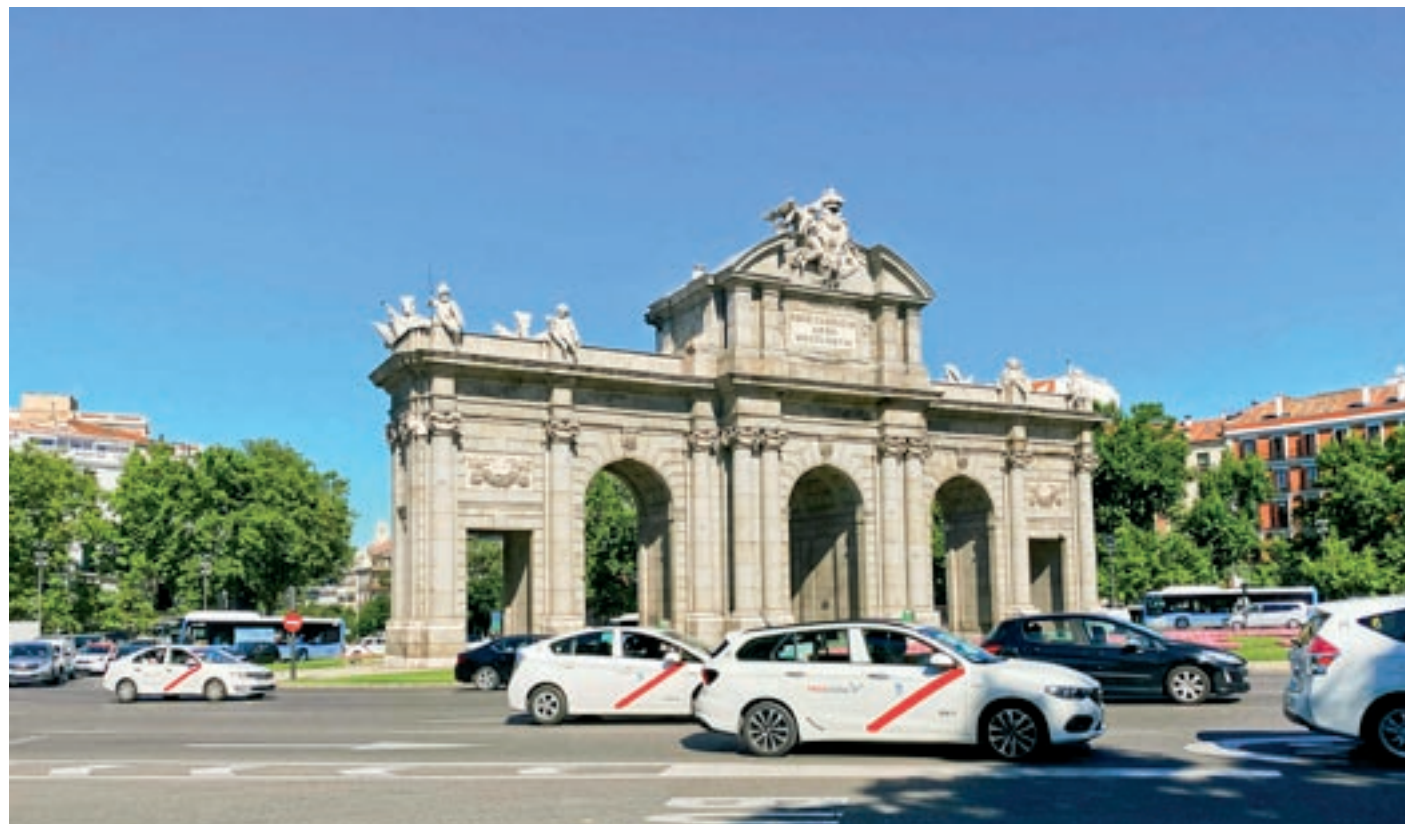
La Puerta de Alcalá, de Madrid. A sota, fotos de punts d'interès turístic de Barcelona