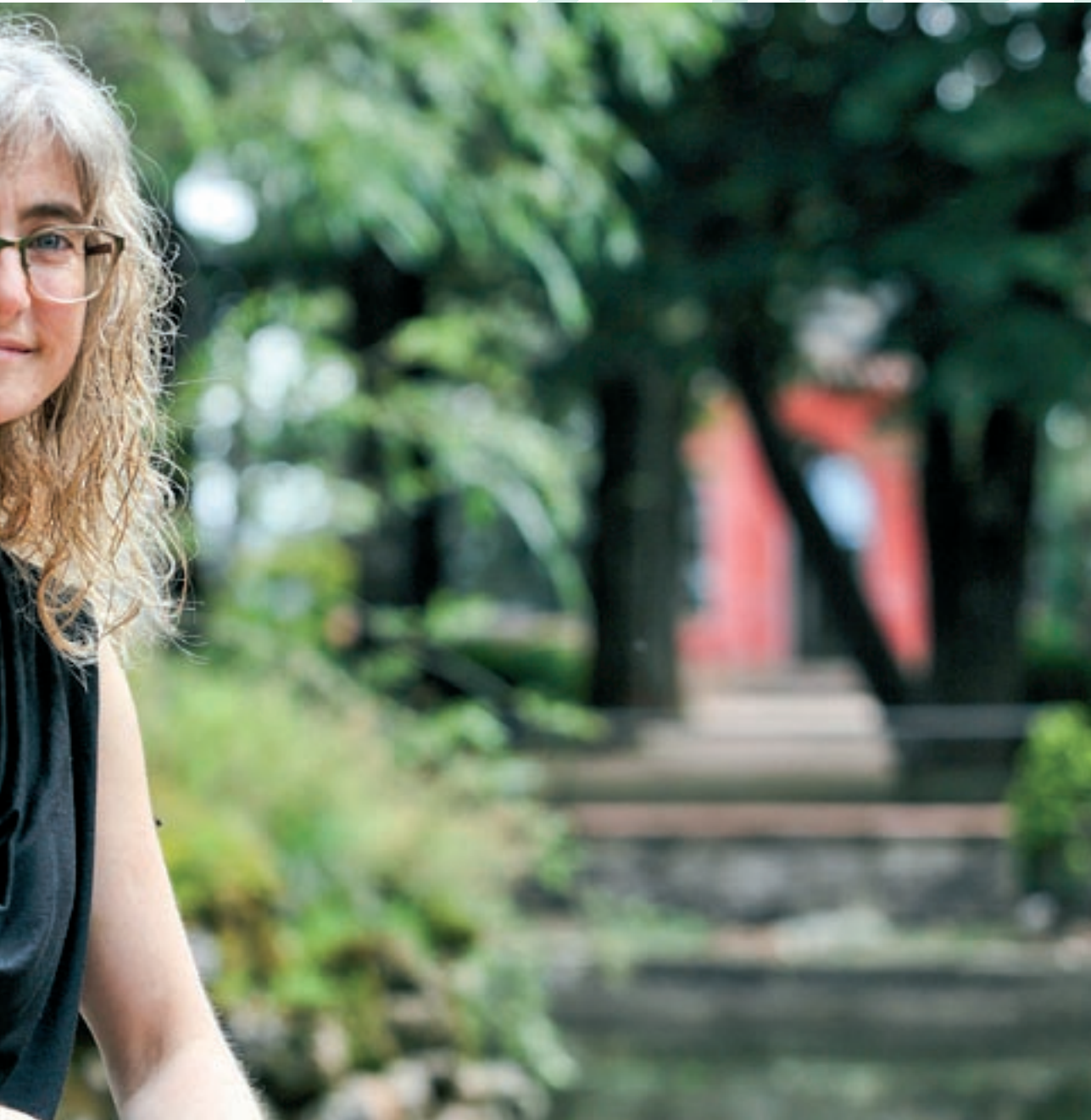
nous estímuls al cervell”

“No és una casa per a malalts, és un allotjament turístic normal però inclusiu”