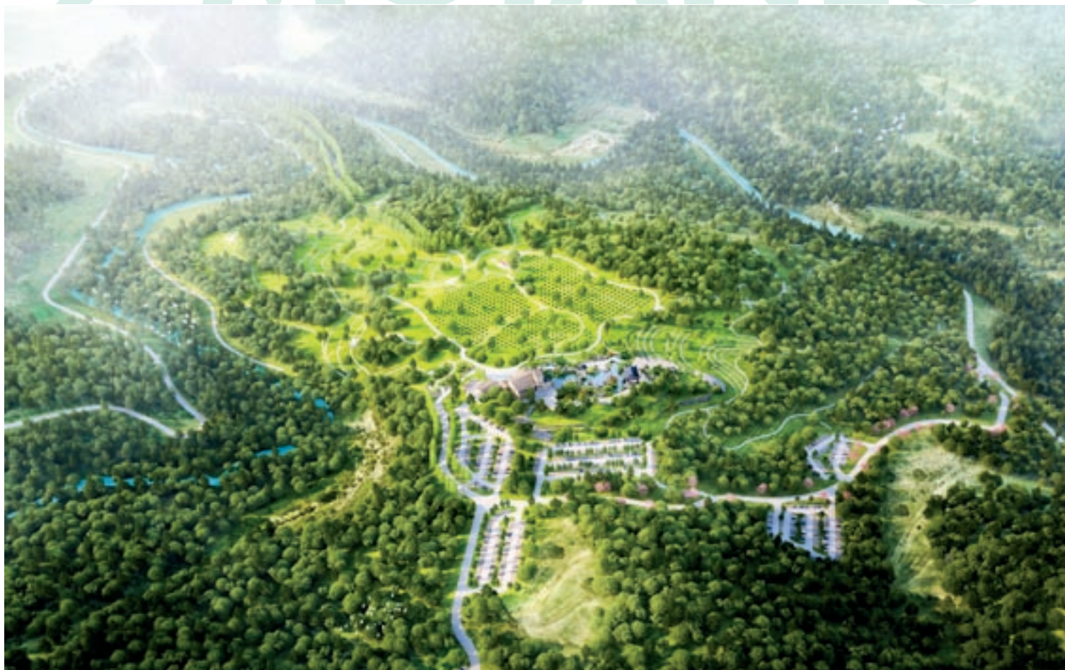
En gran, una imatge virtual del cementiri projectat a la Païssa. A l'esquerra, alguns detalls: l'estany amb una residència zen d'aigua, les sepultures del bosc i l'arc de benvinguda al recinte