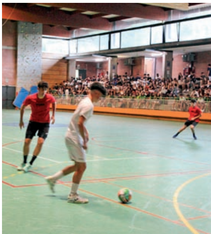
El torneig concentra cada dia, i durant sis setmanes, centenars d'aficionats i jugadors al pavelló de Castellterçol