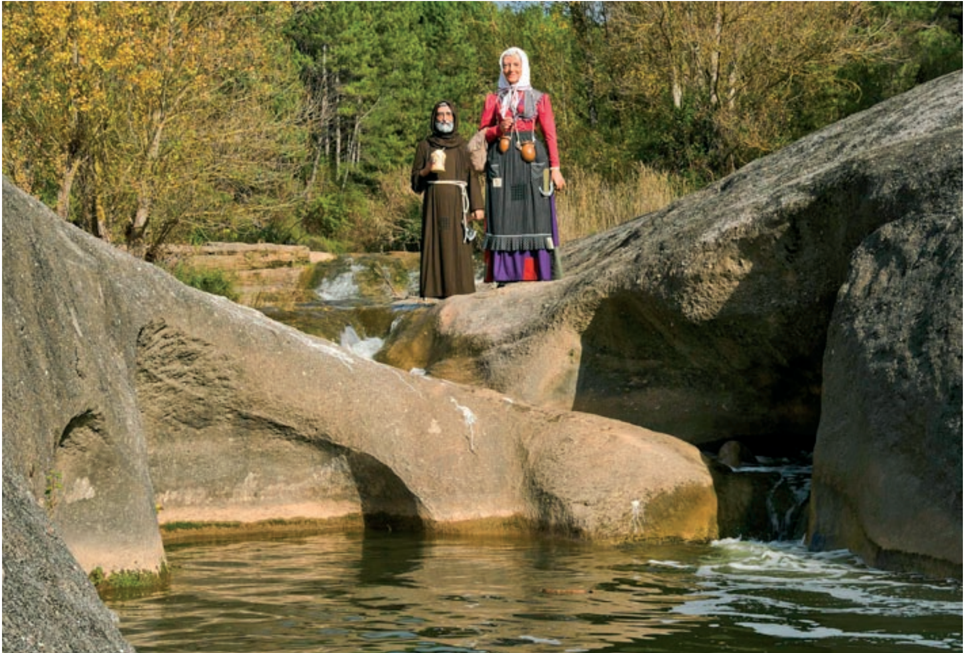
El Llúpol i la Rabassola, als gorgs Blaus de Monistrol de Calders