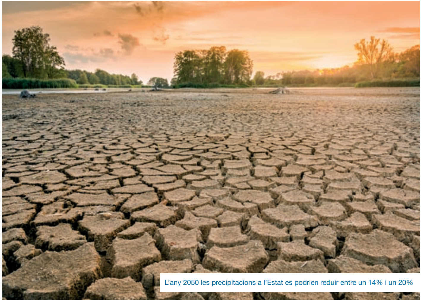
L'any 2050 les precipitacions a l'Estat es podrien reduir entre un 14% i un 20%

En principi, l'escalfament global a escala planetària suposa un increment de les precipitacions perquè el progressiu augment de la temperatura provoca una major evaporació i, per tant, més humitat a l'atmosfera, cosa que hauria de produir més precipitacions. Però tal com assenyalava l'estudi, "aquesta tendència no es produeix de manera homogènia" i els escenaris desenvolupats pels científics del Grup Intergovernamental sobre el Canvi Climàtic (IPCC) suggereixen que en les latituds mediterrànies l'es-