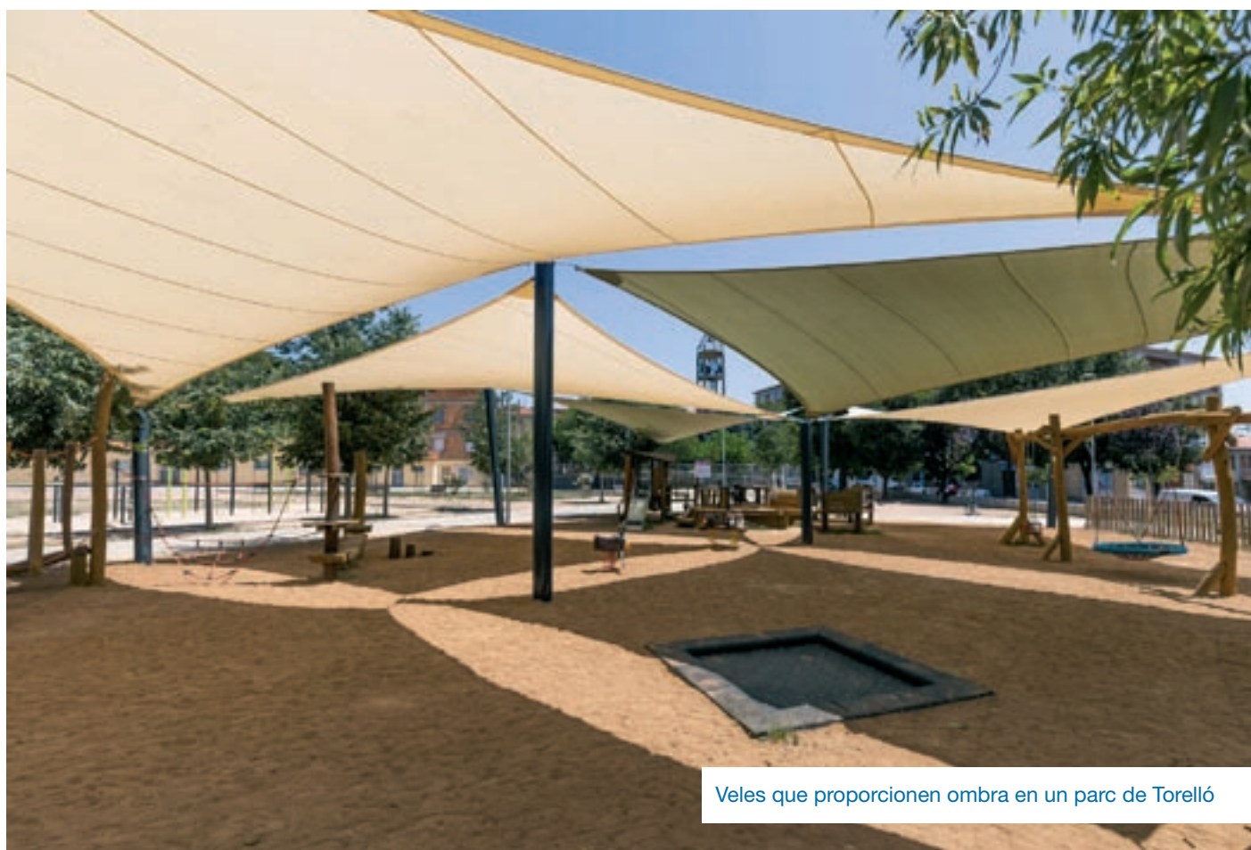
Veles que proporcionen ombra en un parc de Torelló