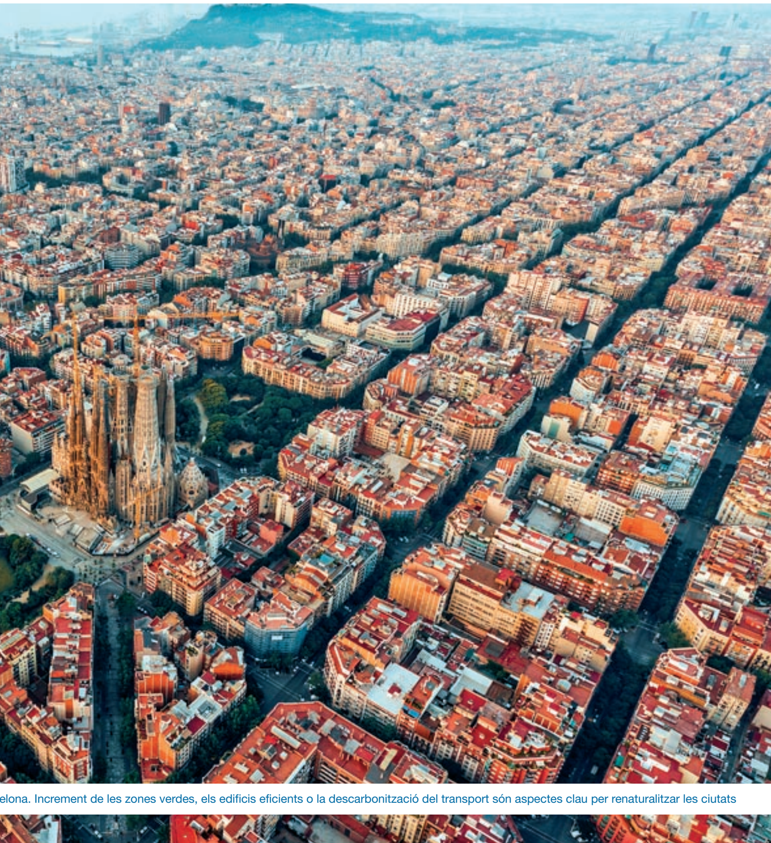
Barcelona. Increment de les zones verdes, els edificis eficients o la descarbonització del transport són aspectes clau per renaturalitzar les ciutats