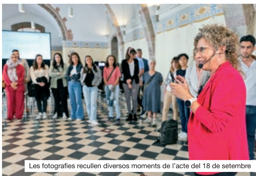
Les fotografies recullen diversos moments de l'acte del 18 de setembre