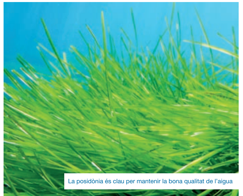
La posidònia és clau per mantenir la bona qualitat de l'aigua

Les plantes marines, entre elles la posidònia, són llar, aliment i refugi per a una gran diversitat d'animals i també "són clau" per a la bona qualitat de l'aigua, ja que fan la funció de filtres. El treball s'està fent a mode de prova al Parc Natural del Cap de Creus, un indret on les praderies de