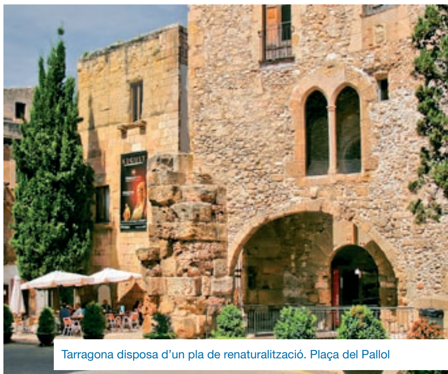
Tarragona disposa d'un pla de renaturalització. Plaça del Pallol

Barcelona té un alt risc de calor extrema. El llindar de temperatura màxima d'impacte en la salut és de 30,4°C. S'estima que les nits tropicals i tòrrides es duplicuin l'any 2100. La demarcació de Barcelona es preveu que estarà per sota del llindar d'adaptació a la calor entre el 2050 i el 2100. La ciutat està just per sobre del límit mínim dels índexs de vegetació i espais verds recomanat per l'OMS, en té un 29,2%. Gairebé el 80% de la població no té accés als espais verds recomanats. Això no obstant, Barcelona té un dels plans d'adaptació més complets dels que s'han revisat en l'informe.