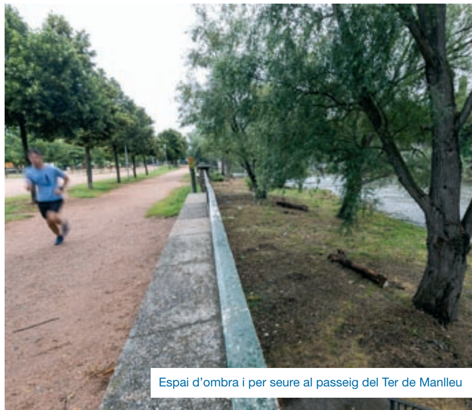
Espai d'ombra i per seure al passeig del Ter de Manlleu

A més, en presentar una major densitat, "el transport públic és molt més eficient". Altres propostes per fer més humanes i respirables les ciutats serien, com apunta el treball, promoure la creació de més superilles i implantar Zones de Baixes Emissions (ZBE).