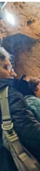
A dalt, la sessió inaugural de les jornades. A les fotos de sota, detalls de les visites que es van fer

va poder estrenar una nova passarel·la a la cova del Toll. Coincidint amb les Jornades, els Serveis Territorials de Cultura han fet una inversió per recondicar l'espai on està previst continuar les excavacions arqueològiques a la Cova del Toll els pròxims anys. D'aquesta manera els treballs es podran compagi-