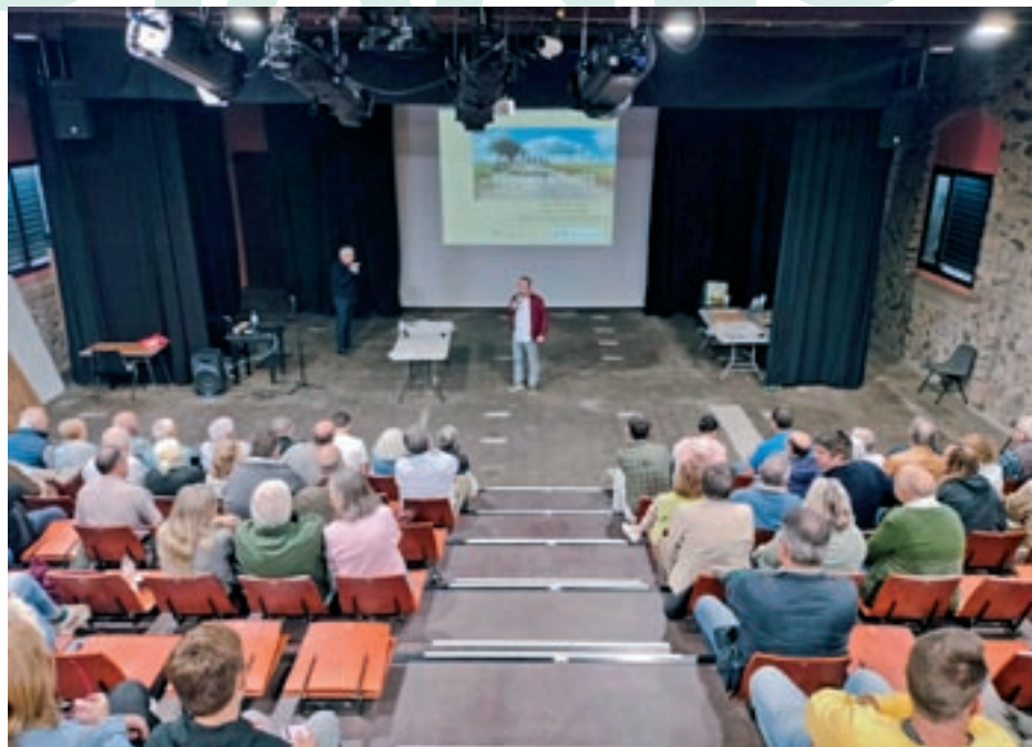
A l'esquerra, un corriol amb tanca a Castellcir; a la dreta, l'assemblea anual de l'Associació de Propietaris Forestals del Moianès i la Vall de la Gavarresa, que va ser el 12 d'octubre a Oló