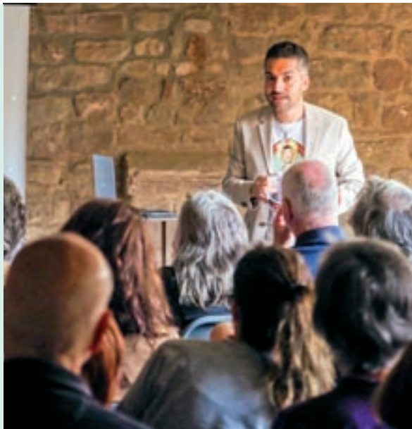
AJUNTAMENT DE L'ESTANY