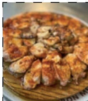
Pop a la gallega