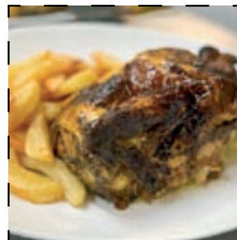
Pollastre a l'ast