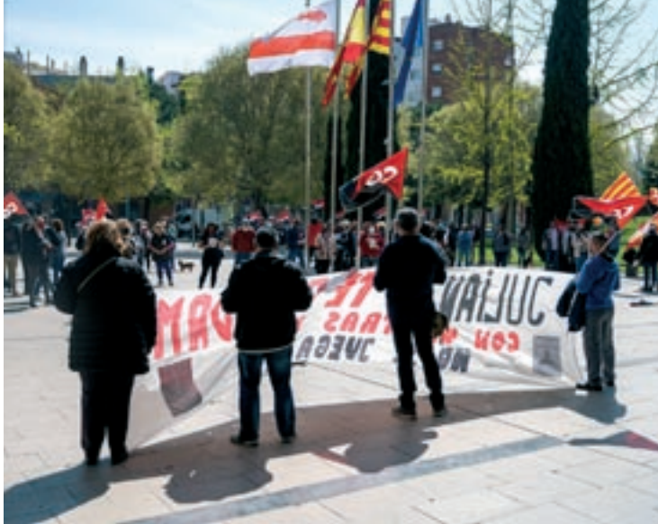
Una concentració en protesta per un accident laboral mortal

L'aspecte més remarcable de l'evolució de la sinistralitat laboral en aquests primers nou mesos de l'any és que la reducció principal es produeix en els accidents de més gravetat. De fet, els 13 accidents greus que s'han produït en aquest període suposen una reducció de 53% respecte a fa un any. Entre gener i setembre s'han produït dos accidents a la feina amb víctimes mortals. És un menys que fa un any.