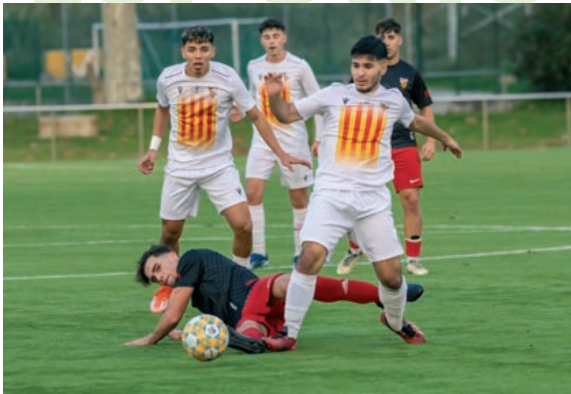
Els jugadors del Parets B i el Martorell en la disputa d'una pilota