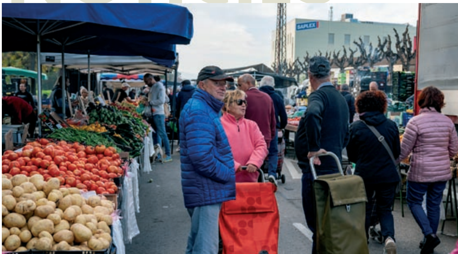
Un grup de compradors davant de les parades de fruita, que en la nova distribució ocupen els dos accessos de la filera de parades al llarg del polígon

El parc dels Colors de Mollet comptarà amb un nou joc infantil. La instal·lació es va començar a fer la setmana passada. Es tracta de tres tobogans per a edats diverses dels quals s'ha recuperat l'estructura, un pont mòbil per enfilar-se, una paret d'escalada i una barra de bombers. També hi haurà diversos gronxadors i un balancí.