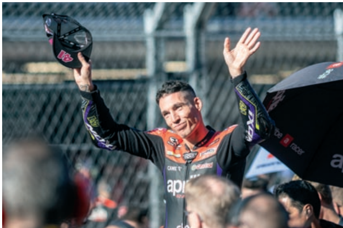
Aleix Espargaró, emocionat, saluda els espectadors després de disputar l'última cursa de MotoGP

Vint anys després, amb un gran palmarès a l'esquena, encara pensa en aquell infant que somiava a pilotar una MotoGP, deixant entreveure la seva part més melancòlica.