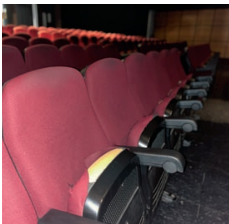
L'estat actual de les butaques