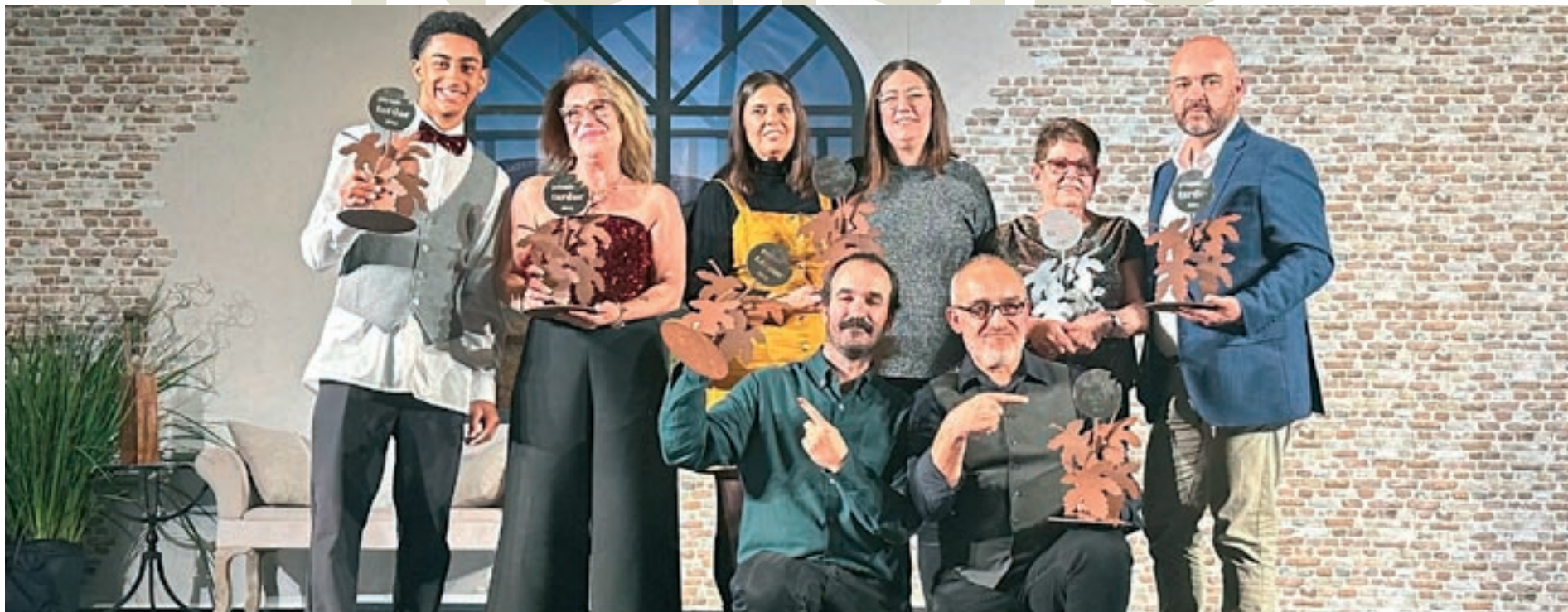
Els guanyadors de l'11a edició dels Premis Tardor, que destaquen les accions de veïns i entitats de Santa Eulàlia de Ronçana