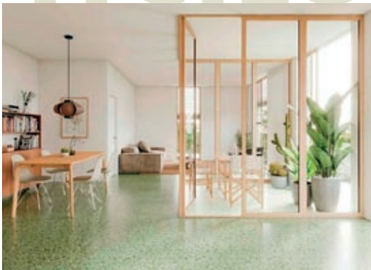
GRISelda ESCRIGAS / AJUNTAMENT DE GRANOLLERS

com a element més característic. Segons van detallar els arquitectes, actua com a vertebrador de l'espai i serveix per organitzar els espais comuns, aporta llum a l'habitatge i millora el confort tèrmic tant a l'estiu com a l'hivern. A banda, els habitatges donen a un pati interior que genera llum a la zona del safareig i dels banys i permet la ventilació creuada dels immobles. Paneque va destacar la qualitat dels projectes d'habitatge públic de la Generalitat. "No tenen res a envejar a les millors promocions de l'àmbit privat." També va valorar l'encaix en "un entorn urbà amable" com és el del Lledoner.