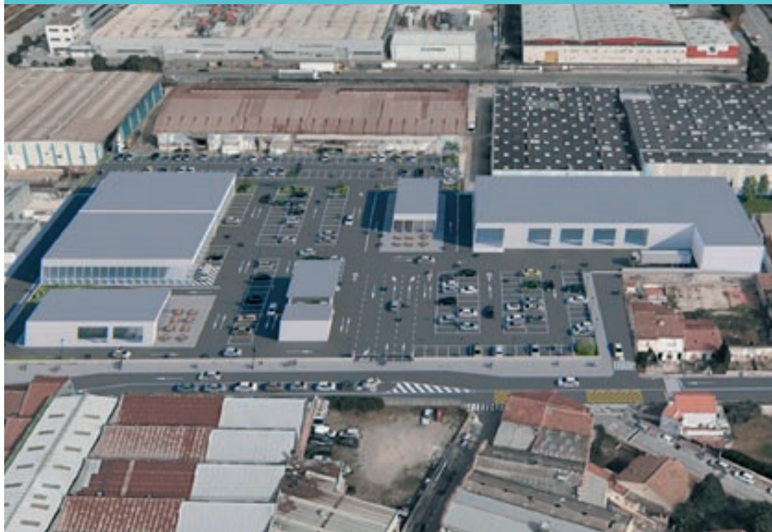
Imatge virtual del centre comercial que López Real Inversiones 21 projecta construir al solar de l'antiga Derbi

Els promotors mantenen l'objectiu d'obrir abans de final de l'any que ve