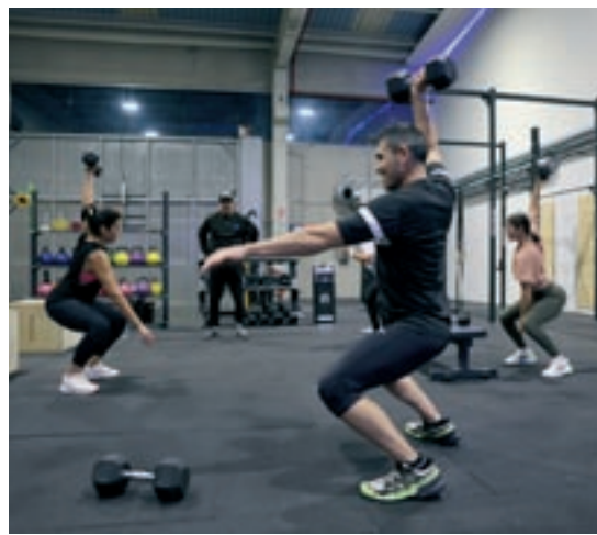
A dalt, el Nou Pàdel de les Franqueses; a baix, el Kraken Bloc de Granollers i l'Oxygen Sport Club de Martorelles