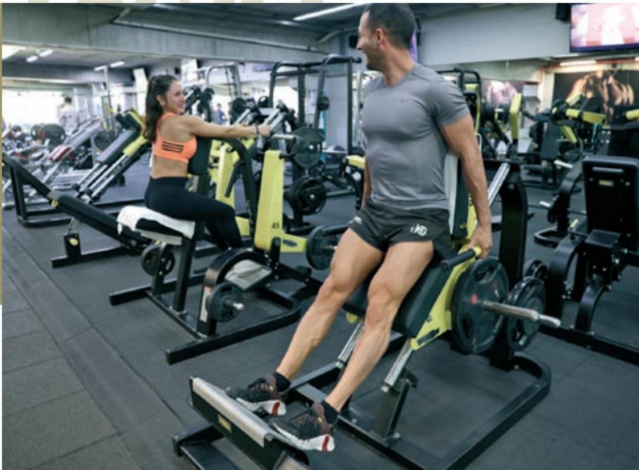
Dos socis del gimnàs Espai Wellness de Granollers a la sala de màquines

Ayats i Cabané també coincideixen que la població està conscienciada dels beneficis de la pràctica esportiva. Els principals usuaris en el cas de Caldes “solen ser homes i dones de mitjana edat, al voltant dels 40 anys, de bon nivell adquisitiu i que valoren molt els temes de salut”,