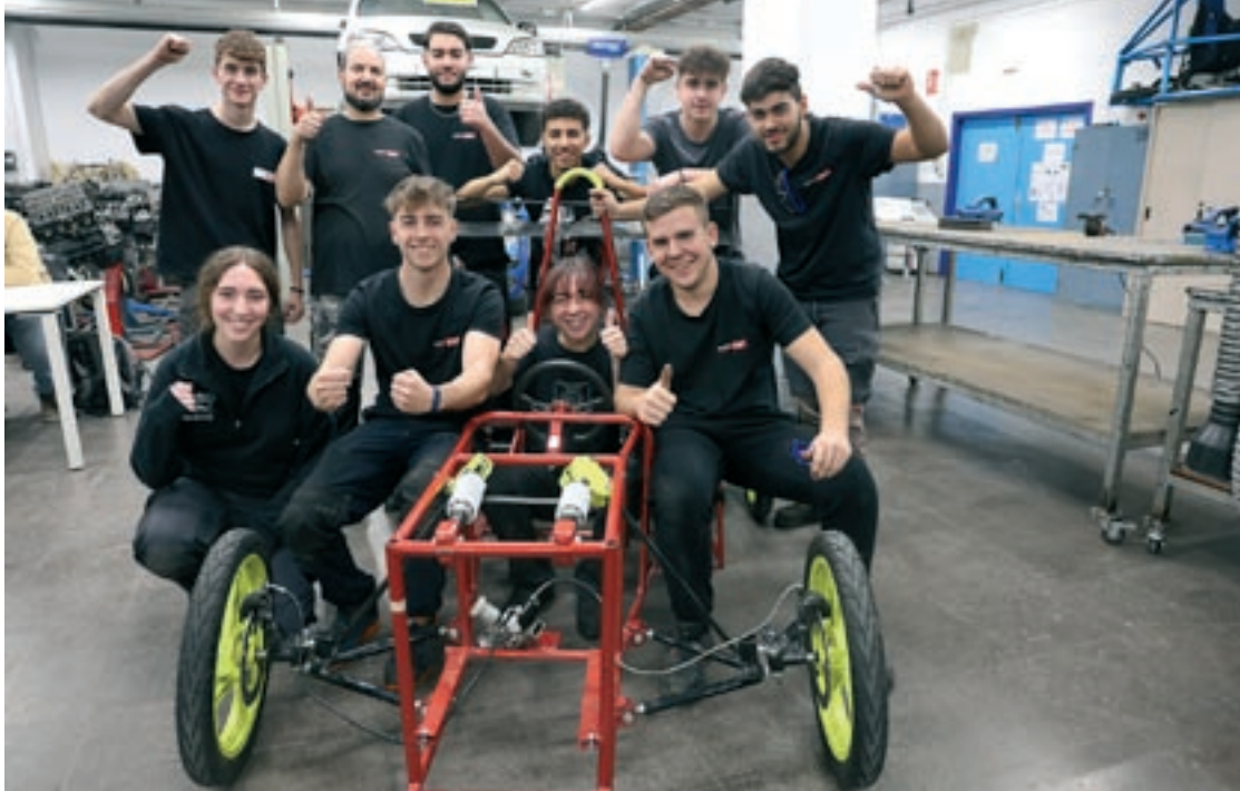
L'equip d'alumnes d'EMT de Granollers que participen en el projecte amb el prototip del curs passat

A l'EMT de Granollers, tenen un repte difícil: superar la segona posició que es van endur a l'Electrocat del curs passat. Dilluns passat el centre va presentar el projecte d'aquest any en una jornada amb alumnes al Kàrting de Cardedeu. Els 12 estudiants de segon d'Automoció que participen en el projecte van poder testar sobre l'asfalt el cotxe premiat amb la plata de l'any passat i també van poder començar a posar negre sobre blanc al nou cotxe. Serà continuista, per no perdre el fil de plata, que volen que ara es converteixi en or, del curs anterior. "El cotxe de l'any passat és de 10 i funciona. El vam posar a rodar a 90 quilòmetres per hora al Kàrting de Cardedeu", explica el profes-