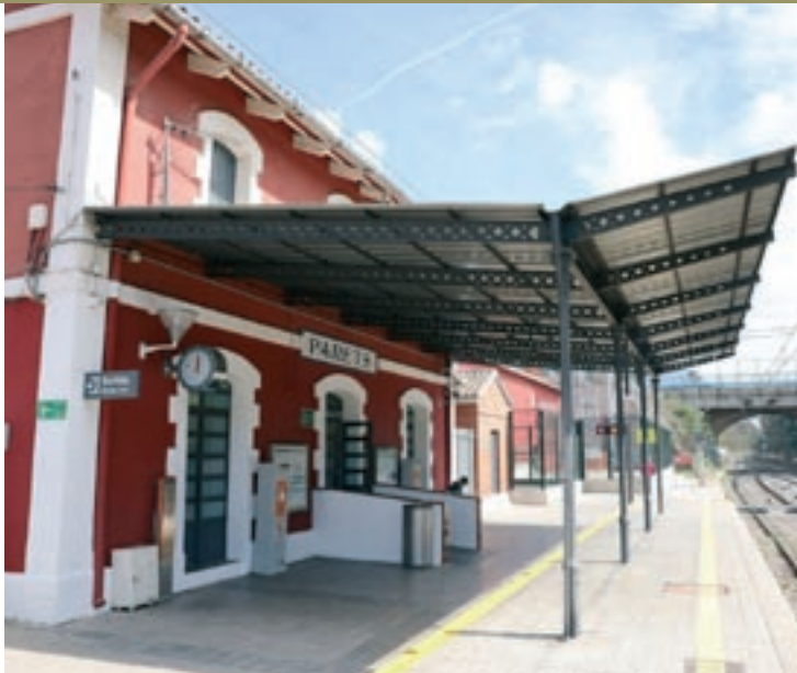
L'estació de Parets en una imatge d'arxiu