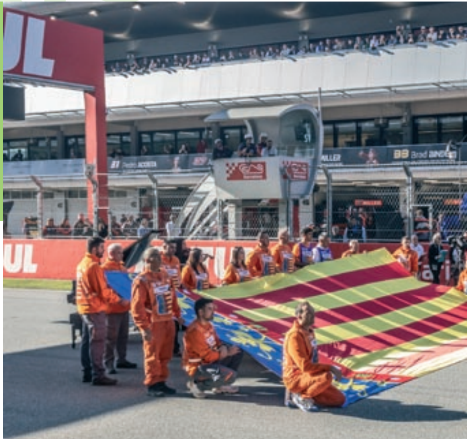
Una bandera de València, amb oficials del Circuit de Xest convidats a la prova del cap de setmana

El moment més emotiu del cap de setmana probablement va tenir lloc minuts abans de l'inici de la cursa llarga de MotoGP, quan diverses autoritats i pilots de la categoria reina es van unir a la graella. Una enorme bandera de València desplegada a la recta principal del Circuit acaparava totes les mirades mentre sonava l'himne de València en un final de campionat excepcional i, sobretot, solidari.