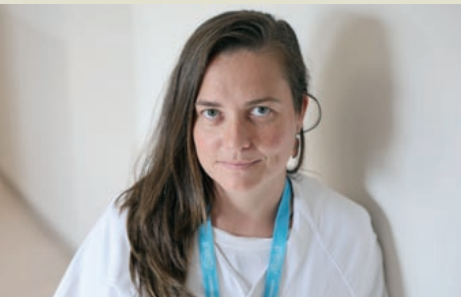
Director de Benestar Emocional i Comunitari del CAP Sant Miquel de Granollers

El box – nom amb què es coneix l'espai – s'omple principalment de gent jove, d'entre 25 i 35 anys. “És un esport que s'ha popularitzat per xarxes i que cada cop té més practicants. Hem escoltat sempre dir que és un esport molt lesiu, però és com tot, si no vas en compte, pot passar. Després de la pandèmia la gent s'ha adonat dels beneficis i ha decidit apuntar-se. Tenim socis que venen a desconnectar per salut mental, però també per estètica”, acaba Zamora.