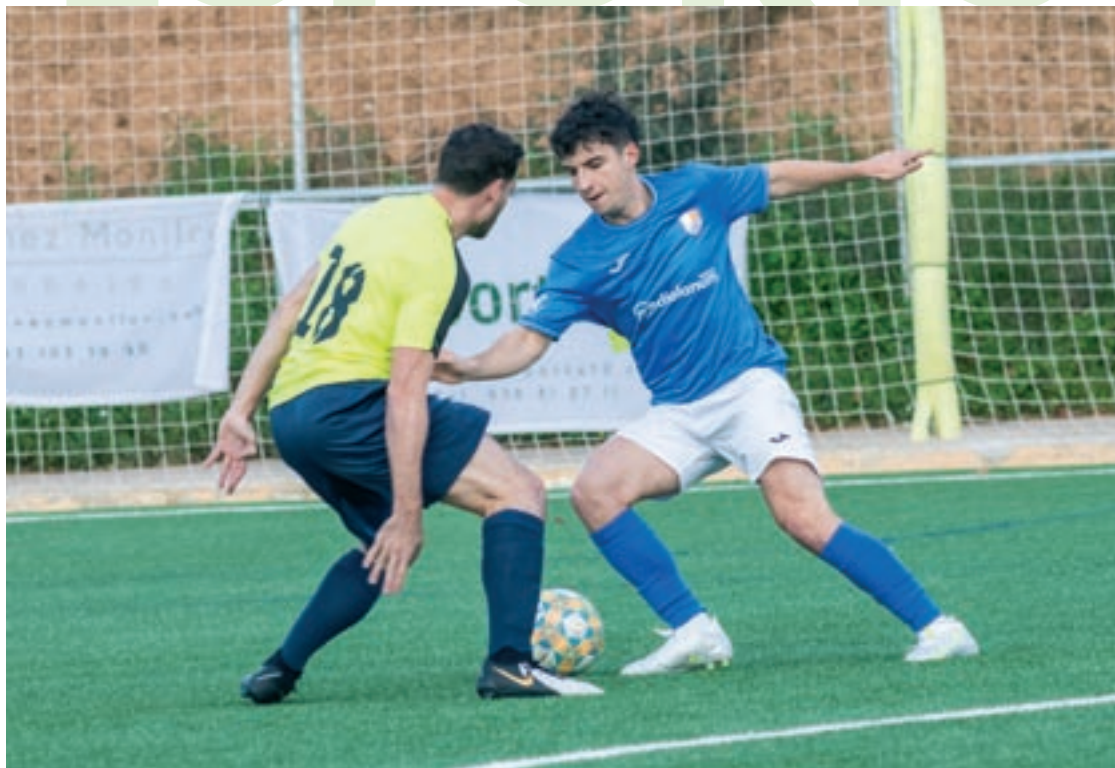
Un jugador del Llerona intenta regatejar-ne un del Vilamajor