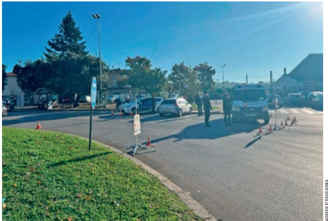
Unitats policials desplegades a l'entorn de l'estació de Granollers Centre dijous passat al migdia

A banda, dues persones van ser citades penalment per tirar endavant un procediment d'expulsió de l'Estat i dues van ser denunciades per infraccions de trànsit. Dos cotxes van ser retirats de la circulació. Durant l'operatiu es van identificar 49 persones i controlar 21 vehicles.