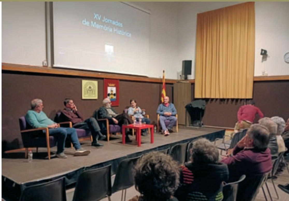
Antics treballadors d'empreses de Palautordera van recordar aspectes del passat industrial al municipi

era administrativa a Can Guiñau i recorda que a la fàbrica hi treballaven famílies senceres. "Tot i que les jornades eren llargues i les condicions de feina sovint eren dures, els treballadors estaven contents perquè tenien