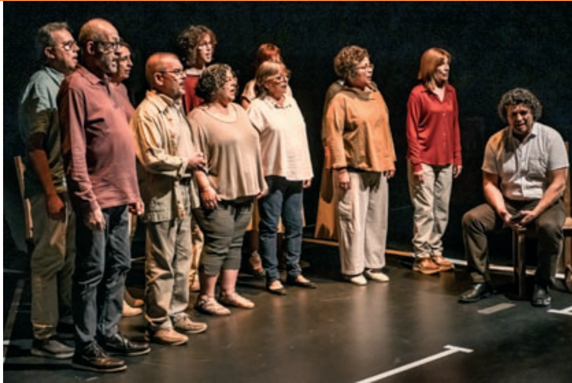
L'espectacle es va fer a la Sala Oberta del Teatre Auditori de Granollers