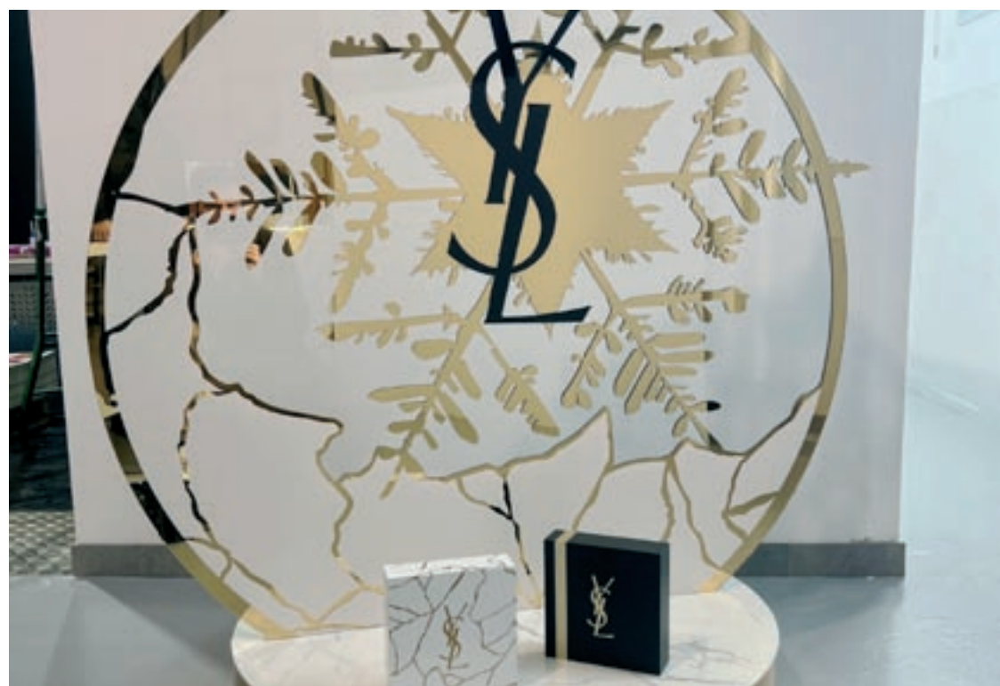
L'expositor d'Adaequo per a Yves Saint Laurent que ha guanyat un dels premis d'aquest any

Les empreses aniran construint els seus edificis, que ocuparan una superfície de 2.499 metres quadrats. Per fer possible l'edificació, Martorelles ha hagut de fer tràmits especials perquè té una població inferior a 5.000 habitants. L'argument que ha fet possible el projecte és que, durant el dia, la població supera aquest llindar.