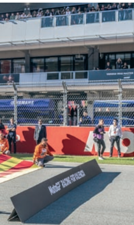
a, va presidir el minut de silenci previ a la cursa