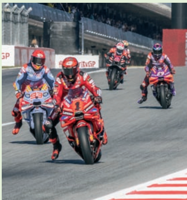
A l'esquerra, Bagnaia al davant de la cursa, seguit de Marc Márquez, Jorge Martín i Aleix Espargaró. A la dreta, Martín eufòric al podi de

Aleix Espargaró, per la seva part, va protagonitzar un dels seus millors caps de setmana de la temporada. Les bones sensacions de divendres ja ho anunciaven. Dissabte, va quedar a tocar de la pole position . A l'esprint, un problema mecànic el va relegar a la novena posició al primer revolt, però, sorprès amb el seu ritme de carrera, va remuntar fins a la quarta posició. Aquest resultat el va fer somiar encara més amb la possibilitat de fer podi o, fins i tot, guanyar, al que havia de ser el seu últim ball com a pilot mundialista.