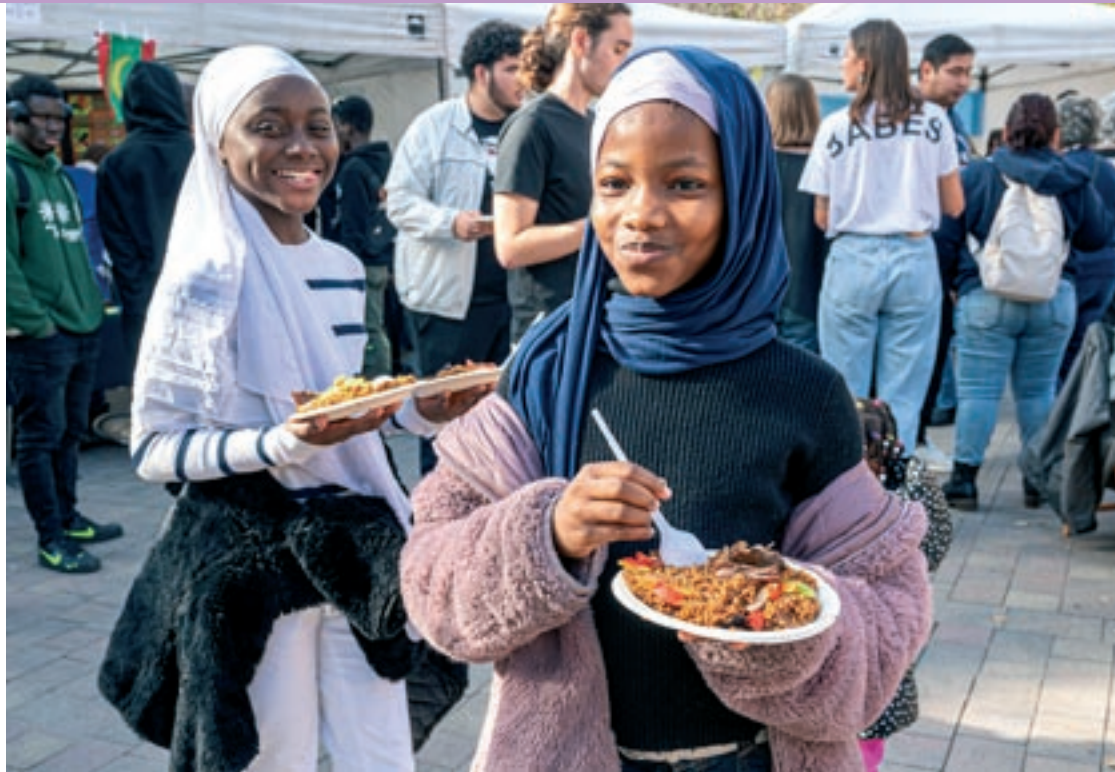
La mostra va oferir plats tradicionals de nou països, amb el Perú com a novetat