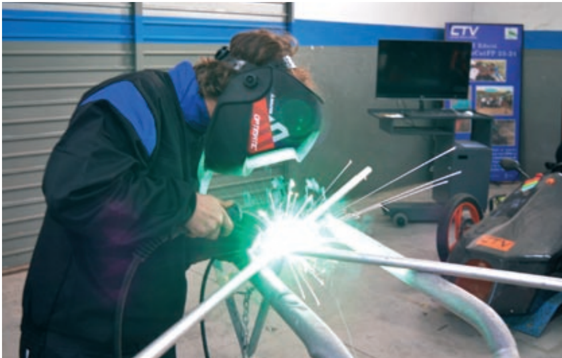
Els alumnes del CTV de les Franqueses ja solden tubs per a la fabricació del xassís