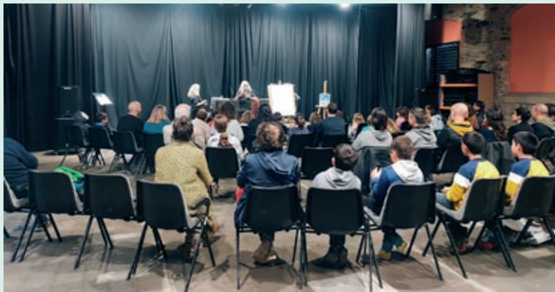
X GERMAN MACIADO

La tercera edició de l'Oló de Lletres, el certamen literari de Santa Maria d'Oló, va viure l'epicentre d'activitats el cap de setmana del 8 al 10 de novembre, amb bona afluència de públic. A la resposta de la gent s'hi va sumar que just el dia abans d'arrencar li concedien un dels premis Lacetània que impulsa Òmnium Bages, lloant la voluntat de transmetre la cultura literària vinculada al poble i involucrar les entitats, èxit que es feia novament palès aquest 2024. El fil conductor de l'edició van ser els mites i les llegendes catalanes, base a partir de la qual es van bastir les caminades, les presentacions de llibres i, entre altres, les taules rodones. La traca final del certamen tindrà lloc el 30 de novembre: una sortida nocturna i de llegendes a la muntanya de Montserrat.