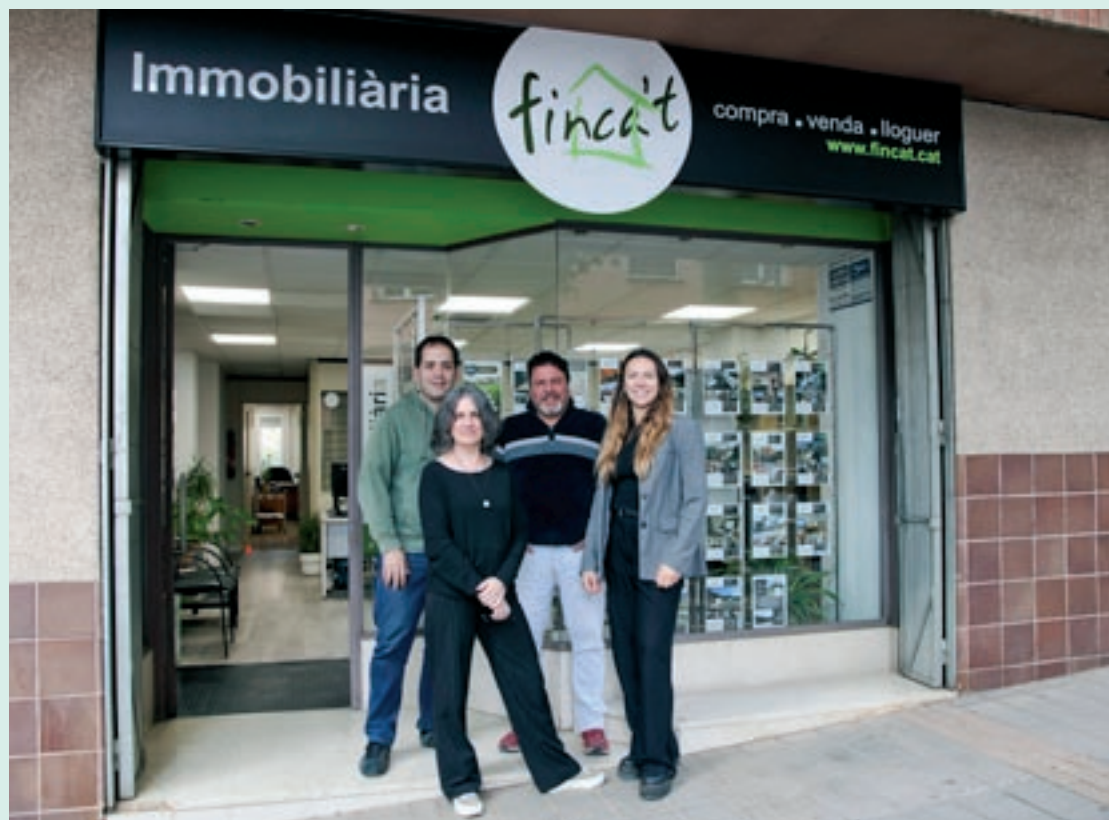
L'equip de Finca't, divendres passat a Moià

Finca't denuncia la falta d'habitatge en una comarca cada cop més poblada