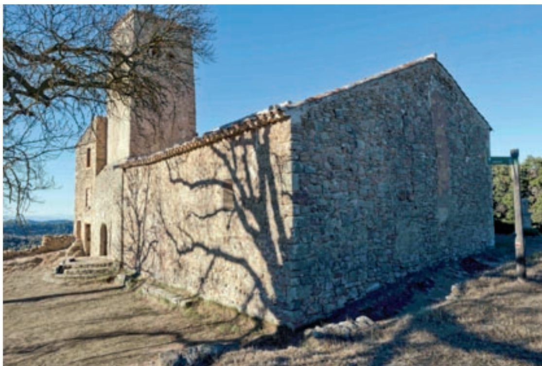
A dalt, treballs de recuperació de les pintures. A sota, una vista general de Sant Julià d'Úixols

litació–, van dissenyar com adequar l'espai per fer-lo accessible a veïns i visitants.