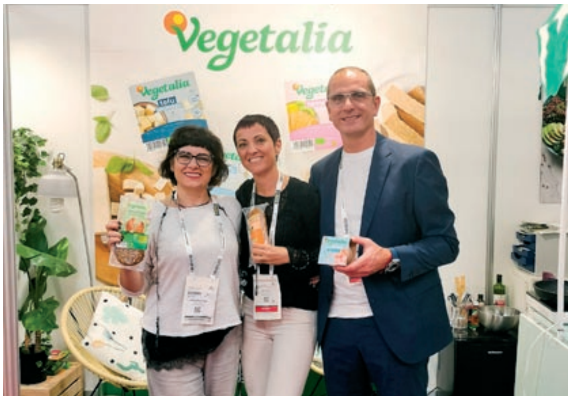
Els representants de Vegetàlia al Fòrum Gastronòmic, que ha tingut lloc aquest novembre a Barcelona

El Fòrum Gastronòmic era un bon moment per fer balanç de la situació del sector a la comarca. I molts dels assistents coincidien que els productors i les empreses dedicades a l'alimentació són