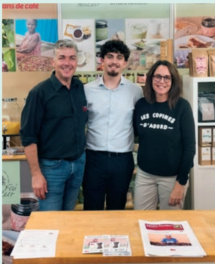
L'equip de Fai Natur, al seu estand